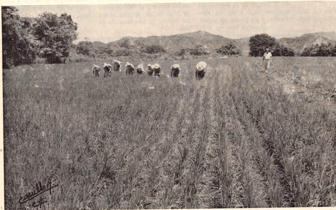
Un arrozal de la Provincia de Alajuela abonado con fertilizantes del Consejo Nacional de Producción.