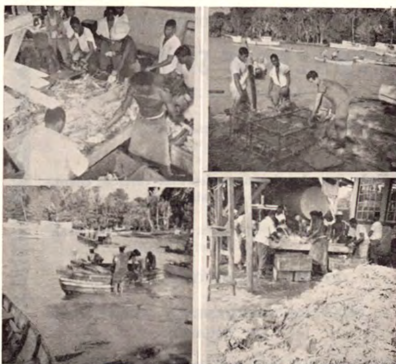
Esta composición fotográfica presenta diferentes aspectos de la pesca e industrialización de la Langosta en puerto Limón.

Así habló el maestro en su clase de cultura aborigen en el Liceo José Martí de Puntarenas.