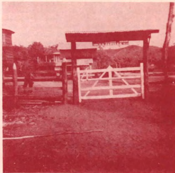
Entrada a la hermosa Hacienda La Javilla.

Y más si el interesado toma en cuenta los riesgos del peligro en el transporte, cuando son pocos los sementales que se ofrecen mansos como los que nosotros ofrecemos.