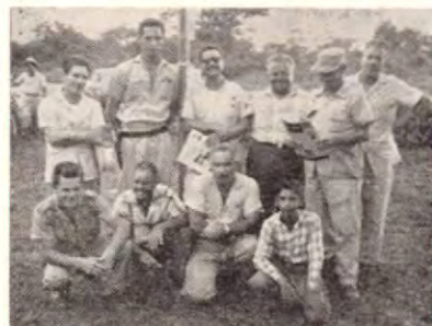
En Paso Canoas, posan para esta Revista los Jefes del Resguardo y varios amigos que nos acompañaban en aquella excursión a Panamá.