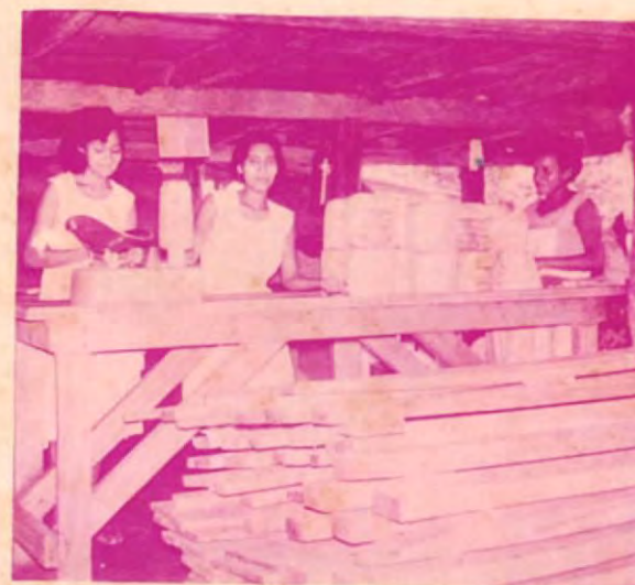
Un aspecto de la Planta

ES LA EXPERIENCIA ACUMULADA DE MUCHOS AÑOS, Y HOY SE ELABORA UN PRODUCTO DE CALIDAD QUE CONSERVA TODO SU RICO Y EXQUISITO GUSTO!!!