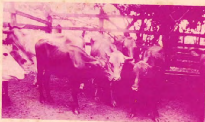
Lote de vaquillas RED POOL de un año