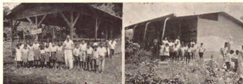
ESCUELITA DE CURIME

A su paso por LIBERIA visite el INTERAMERICAN DRIVE INN