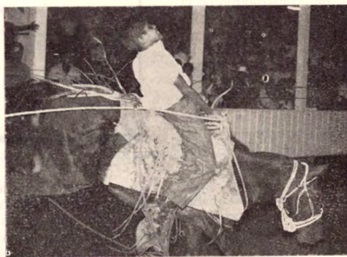
Un pequeño "campista" montando un potro chúcaro en la Exposición.