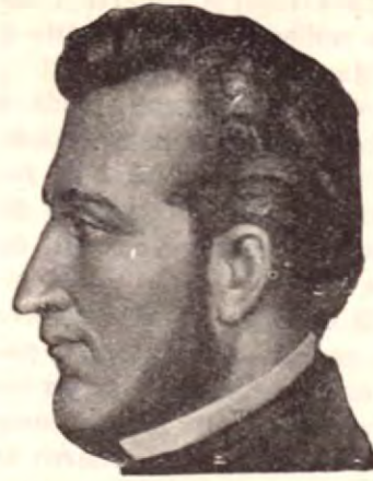
General Francisco Morazán

Del lado del mar todavía no habían construcciones y observada Puntarenas por ese lado, daba la impresión de un sitio remoto cualquiera, ensamblado entre la maleza y raquítica vegetación tropical. Así debieron verla con sus catalejos la oficialidad y comandantes de las huestes salvadoreñas del General Morazán el siete de abril de 1842, irrumpiendo en el golfo, como para que el Capitán Saget, a cargo de la escuadra invasora, no se aventurara a desembarcar allí y prefiriera seguir aguas al Este hasta el puerto de Caldera, de escaso movimiento e inferior en categoría a Puntarenas. Allí ancló y bajó "sus tropas de centroamericanos" con las cuales venía a deponer el gobierno de don Braulio Carrillo,