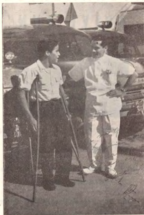
El Doctor, sin faltar a sus estudios, daba su concurso a la Cruz Roja Mejjicana