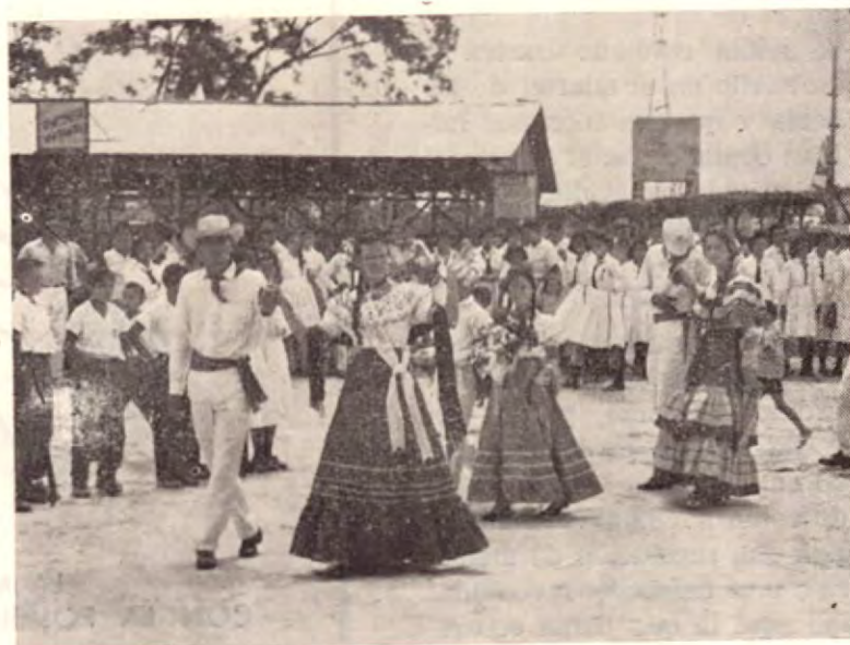
La reina y su cortejo desfilan por las calles de Liberia.