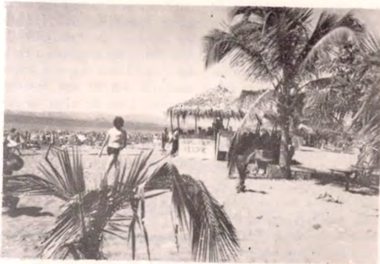
Una vista de la playa de Puntarenas

A SU VEZ, EL PUERTO SE VISTIO DE GALAS PARA RECIBIR TANTO TURISMO