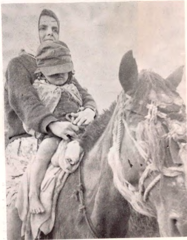
Con la tristeza y el pánico que todavía la invade, esta mujer y su niño huyen del peligro, dejando abandonado su hogar por el pueblito de La Cavanga, arriba de Caño Negro, por Tilarán.

• HIZO VIVIR DIAS TERRIBLES DE ANGUSTIA, SANGRE Y