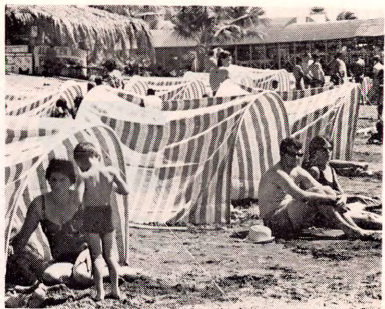
Gozando de las preciosas playas de Puntarenas

PUNTARENAS: Apartado 275 OFICINAS: 50 varas al este del Club Chino