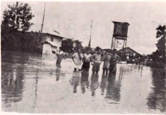
Las inundaciones del año 1955