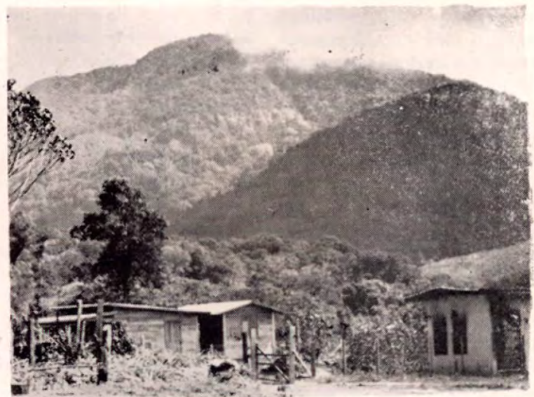
CASERIO LAS MELLIZAS, EN LA FRONTERA SUR. Bonitos rincones de la patria tica, escondidos entre la montaña y el cerro empinado. Al fondo se divisa el pico de "La Quijada del Diablo".