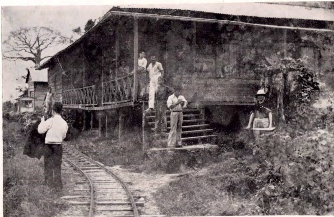
El antiguo Comisariato, para el expendio de comestibles a la gente de la finca establecido en Boca Naranja (1927)

Desde esta revista lo saludamos afectuosamente.