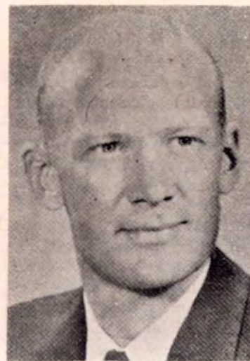
EDWIN E. ALDRIN

Caminó por el espacio durante 33 minutos, y pasó otros 49 minutos de pie sobre el asiento de la nave espacial, tomando fotografías de la Tierra por la escotilla abierta. El teniente coronel Collins y su esposa tienen dos hijas, de 10 y de 7 años, y un hijo de 6.