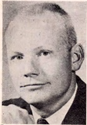
NEIL A. ARMSTRONG

Fue el comandante del vuelo a la Luna del Apolo 11. Mientras Michael Collins permanecía en el módulo de mando en la órbita de la Luna, Armstrong y Edwin E. Aldrin descendían en el módulo lunar, para ser los primeros en pisar la superficie de la Luna. Nacido en Wapakometa, Ohio, el 5 de agosto de 1930, el Sr. Armstrong obtuvo a los 16 años su licencia de piloto; participó en 78 misiones de combate como piloto naval de los Estados Unidos en la guerra de Corea, se graduó como ingeniero en aeronáutica en la Universidad Purdue en 1955 y durante los siete años siguientes trabajó como piloto de pruebas, y llevó siete veces el avión-cohete experimental X-15 a la frontera del espacio, a más del quintuple de la velocidad del sonido.