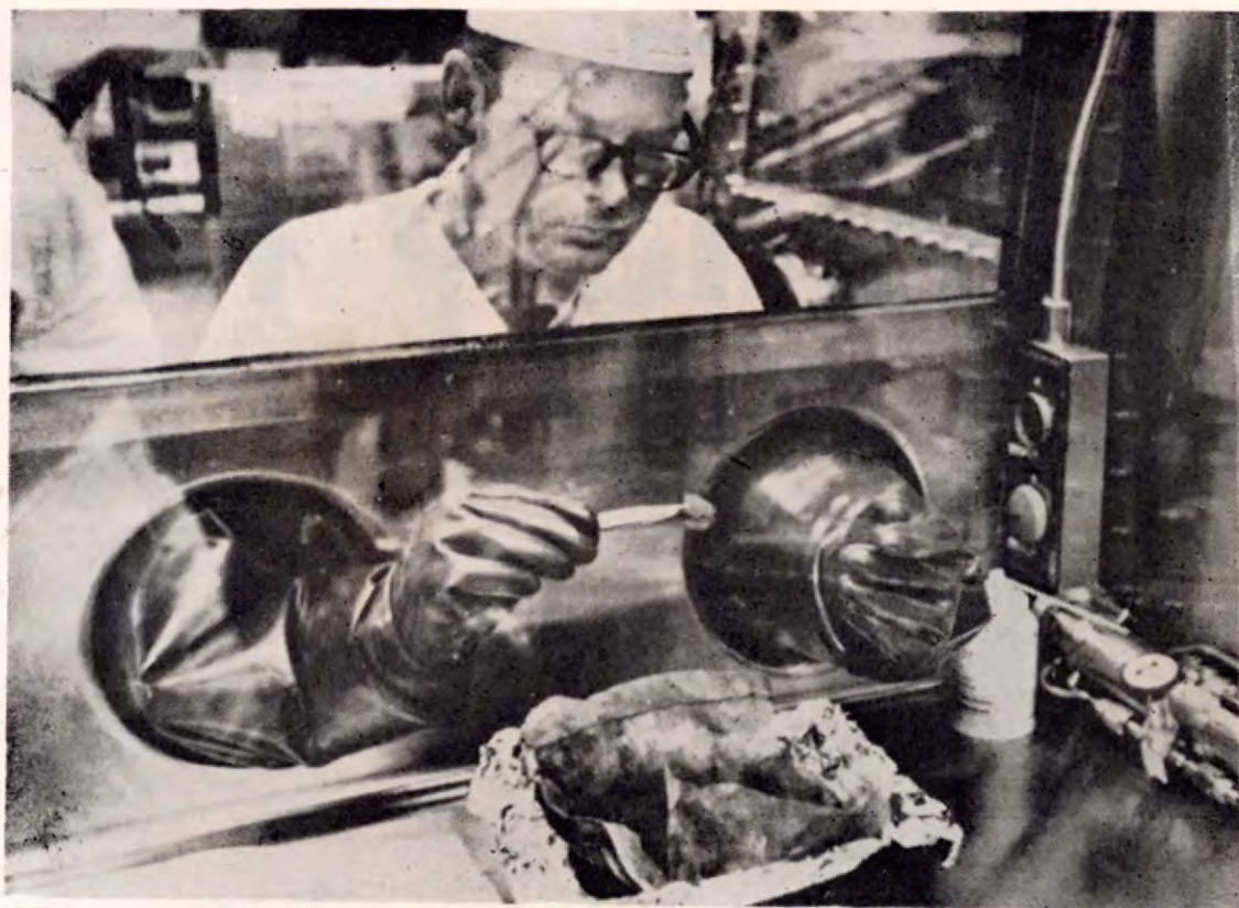
Científicos examinan partes rocosas que trajeron los astronautas.

R. A todo esto hay que contestar simplemente que así es la manera de ser de la gente.