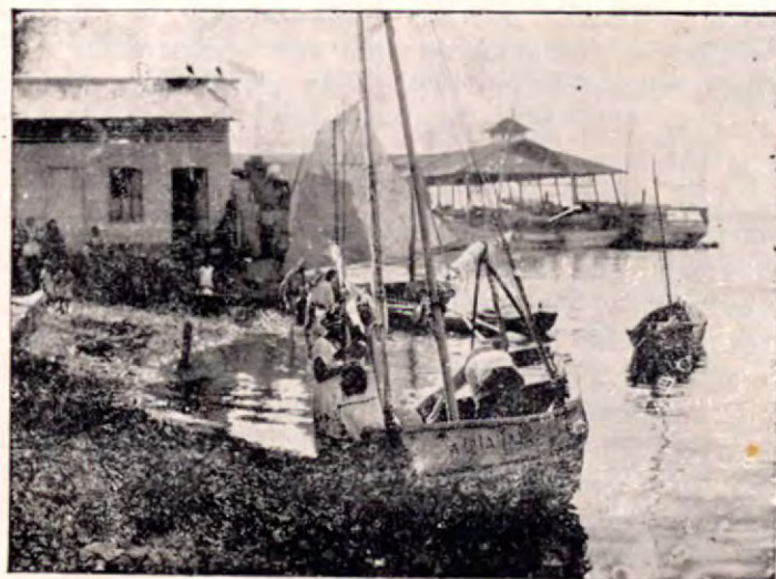
Al fondo se puede observar el otro, el que construyó don Ricardo Jiménez en 1914. Ya desapareció también.

Cuando visite CARTAGO Recuerde pasar por el