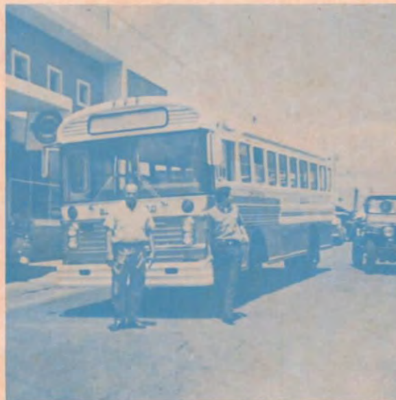
Una de las dos unidades recientemente puestas en servicio.