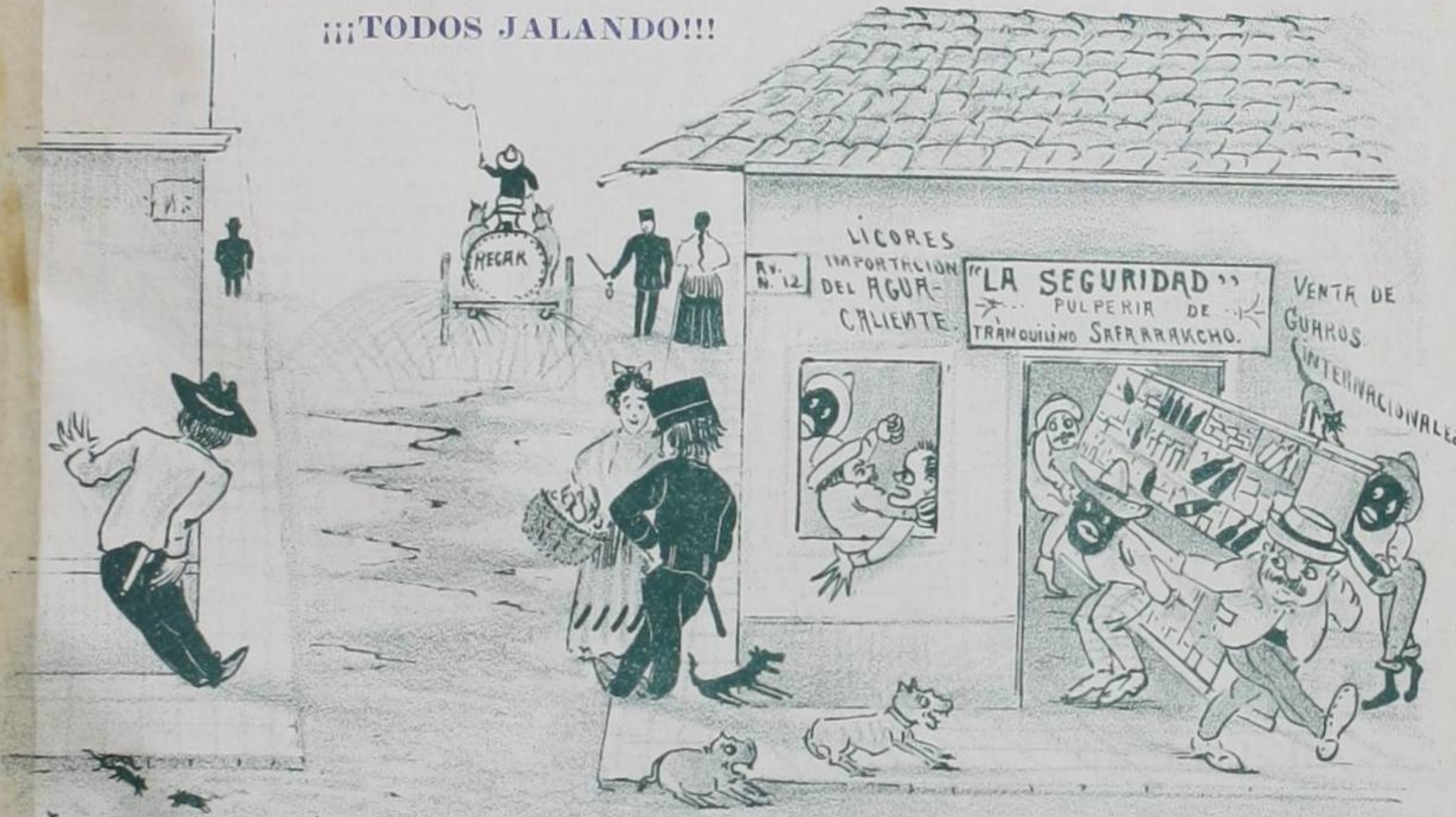
Sujestiones mundiales (Cuadros típicos)