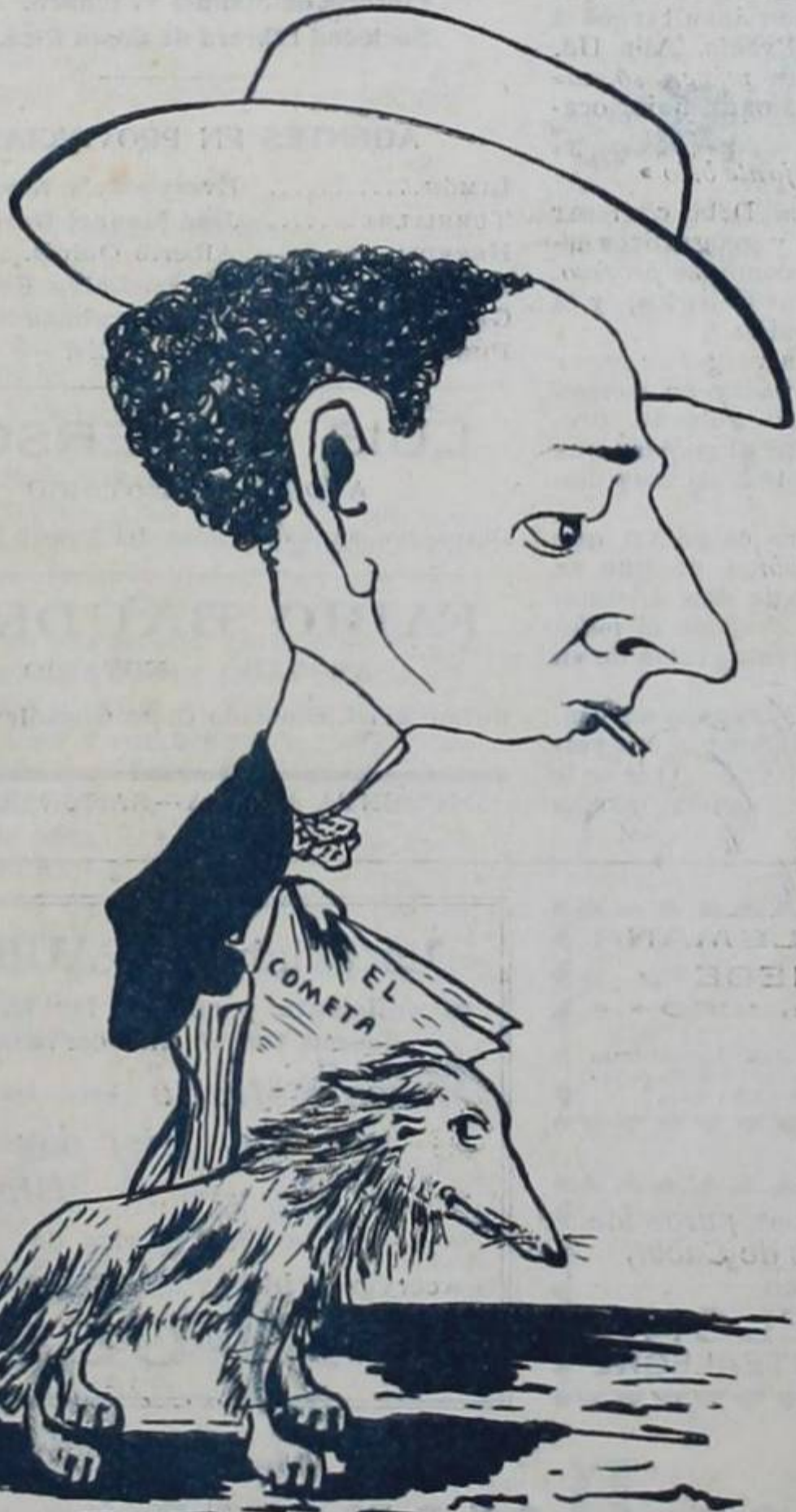
El Director de EL COMETA