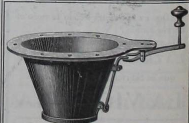
Excusados Secos-Inodoros El mejor sistema donde no hay cloacas.— Esquina diagonal á ROBERT HWOS. MACAYA & Cia.

BOtar su dinero comprando menjurjes desconocidos ó Tirarlo inconsideradamente en específicos dudosos y CARos, es sencillamente una locura.—Hablando con FRANqueza, aconsejámosle que, para evitar un percanCE desagradable tome sus drogas en una botica prestigioSA y honorable.