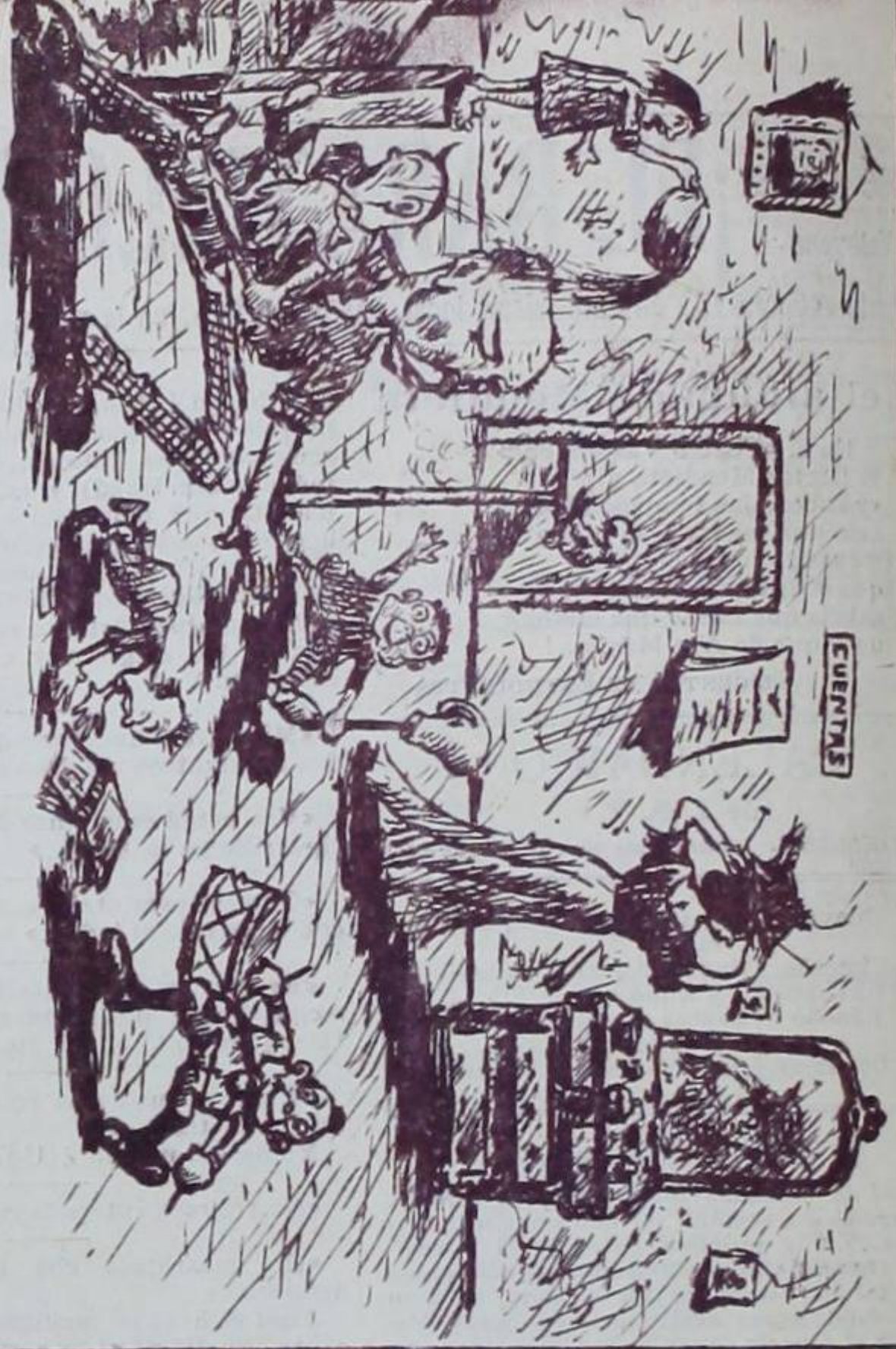
Valses populares "Sueño nupcial"