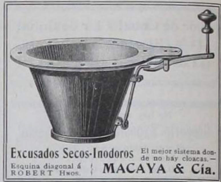
Excusados Secos-Inodoros El mejor sistema donde no hay cloacas.— Esquina diagonal á ROBERT Hnos. | MACAYA & Cía.

BOtar su dinero comprando menjurjes desconocidos ó Tirarlo inconsideradamente en específicos dudosos y CAros, es sencillamente una locura.— Hablando con FRANqueza, aconsejámosle que, para evitar un percanCE desagradable tome sus drogas en una botica prestigioSA y honorable.