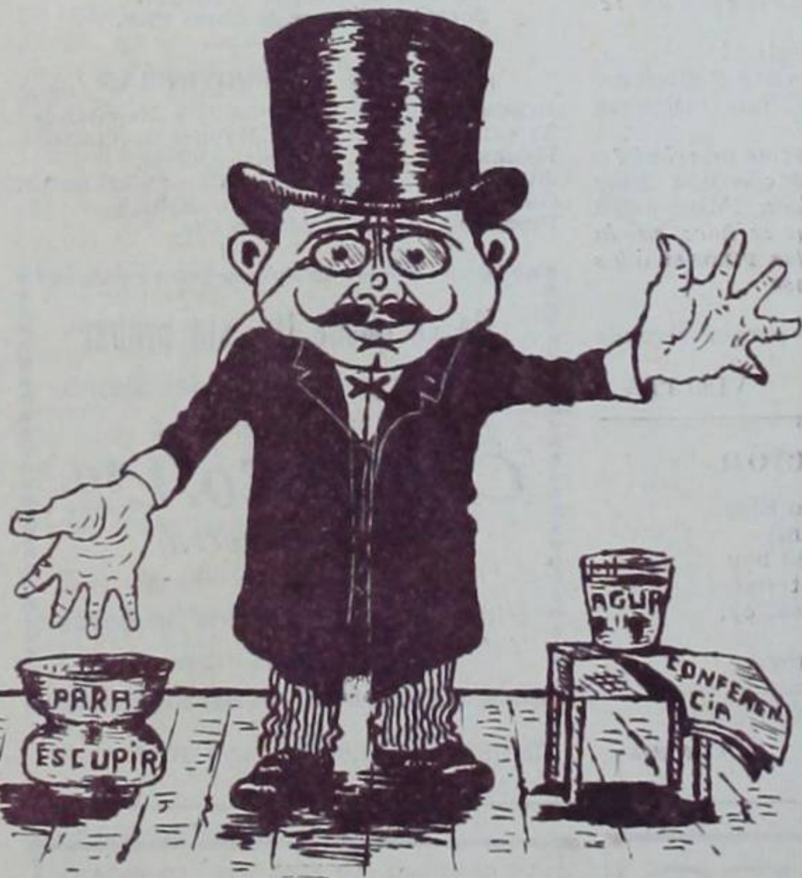
EL ILUSTRE MENDIETA

el llanto su voz comprime, y haciendo un gesto sublime, en pro del Tratado vota sin ver que á sus pies, ya rota, su opinión solloza y gime.