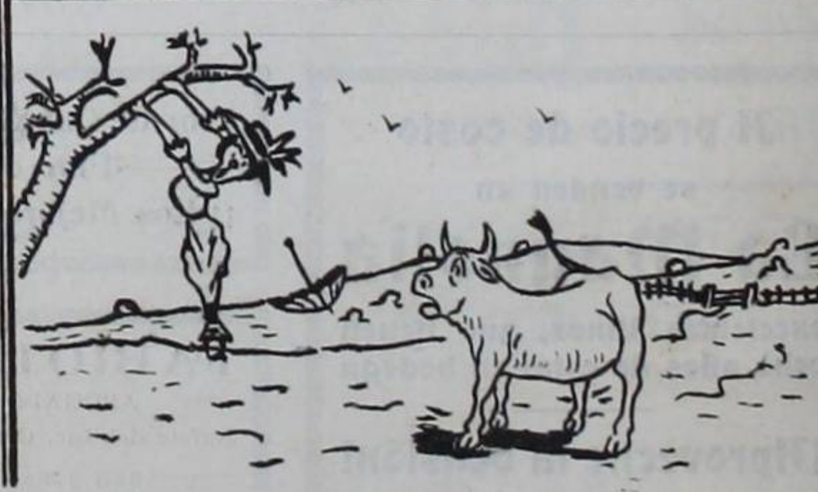
dejarás al cornúpeto chasqueado, si existe un árbol cerca y das un brinco de tres ó cuatro metros.... ó de cinco, porque debes tener mucho cuidado de no hacer el portlado.....