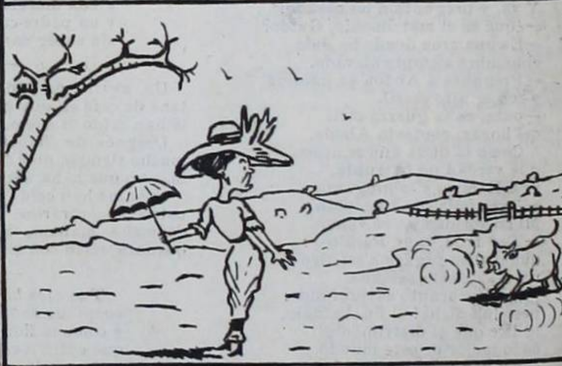
Si, cruzando un potrero, te acomete oh niña, en ese traje, algún torete.....