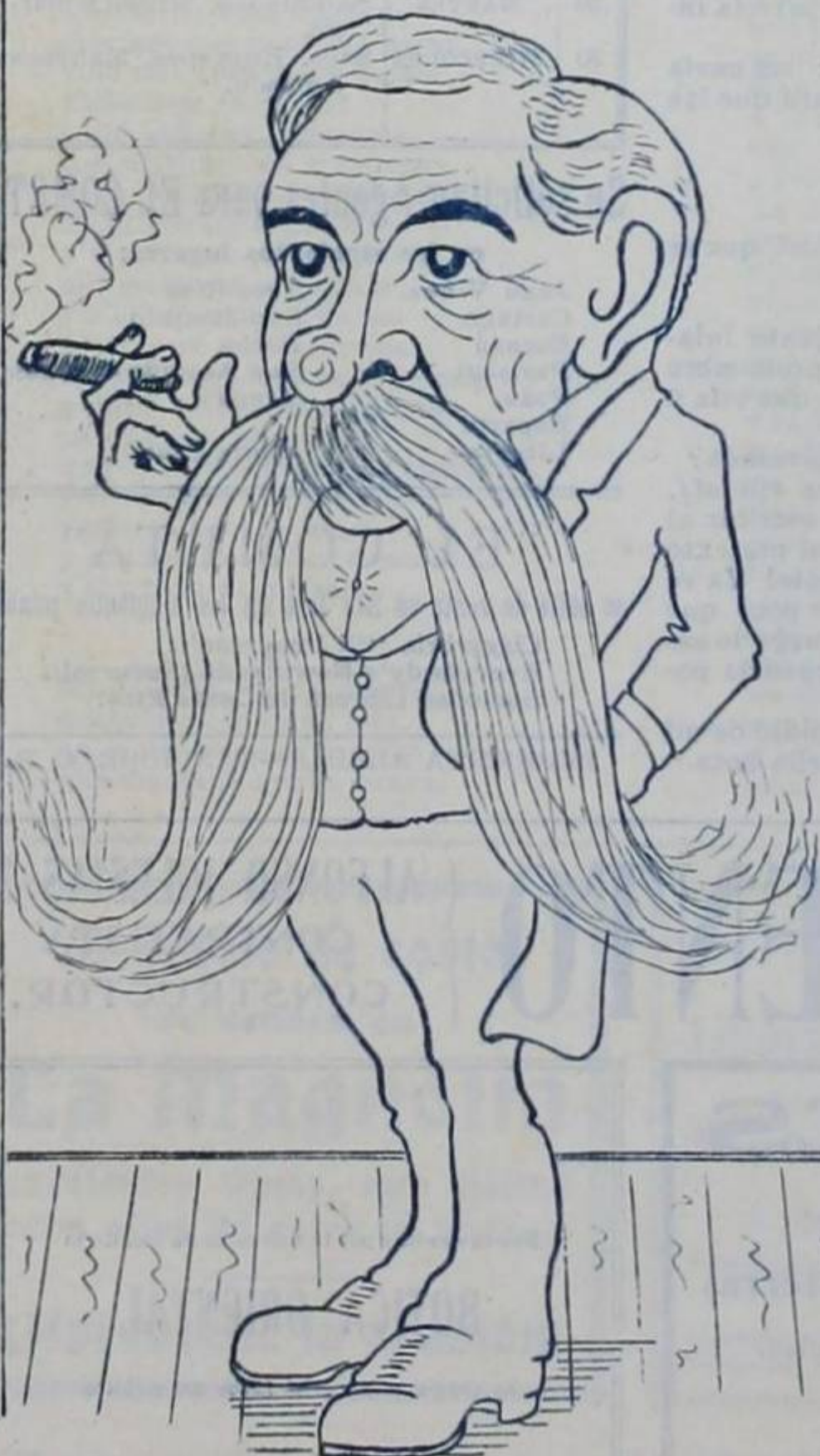
Un retrato popular que todos guardan muy bien... si en un billete de cien se lo llegan á encontrar. ¡Feliz quien pueda juntar,