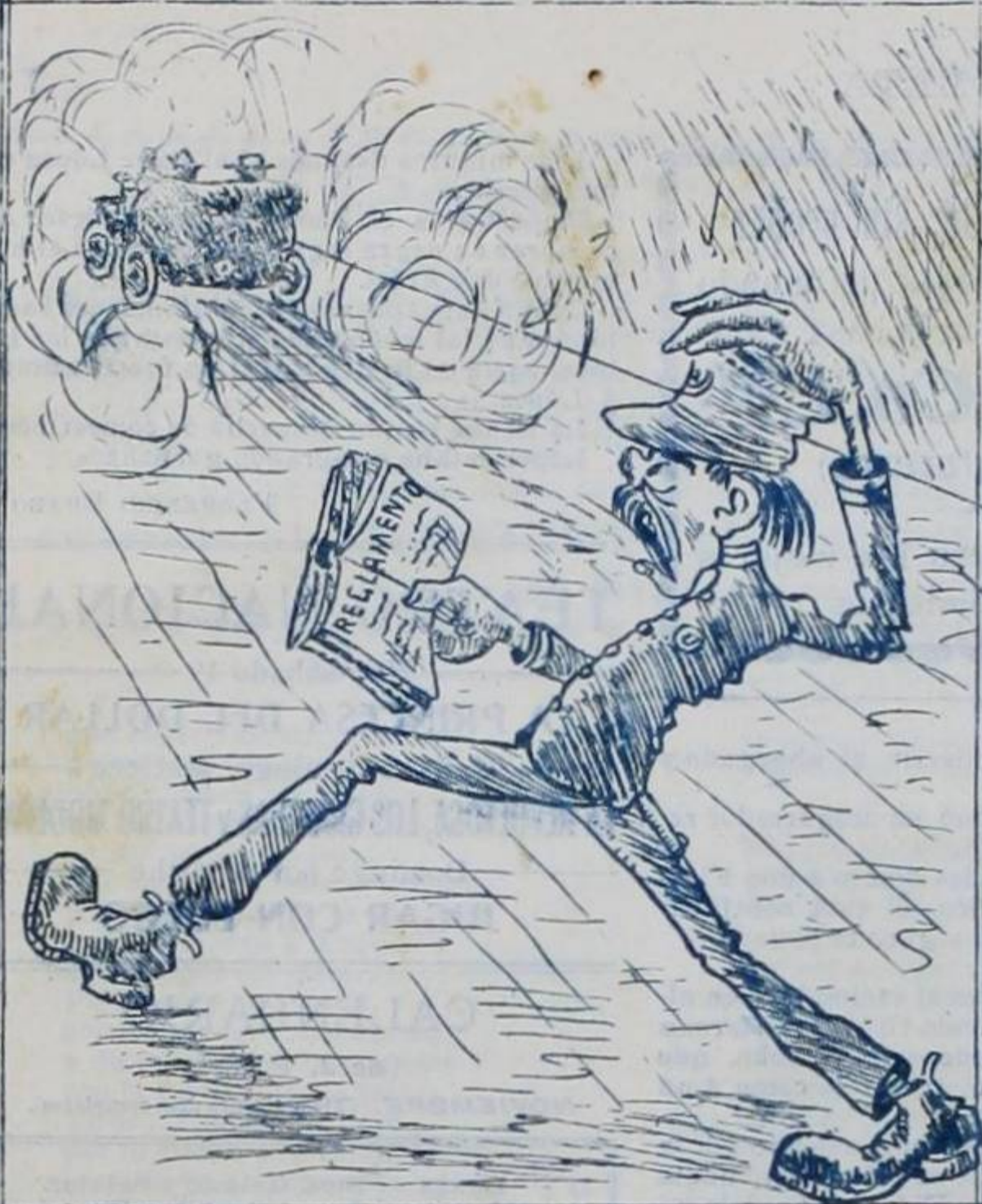
EL POLICIA.—¡Qué vaina tener que correr una hora detrás de ese chunche pa ver si se tira más de los veinticinco kilómetros que permite el Reglamento...!