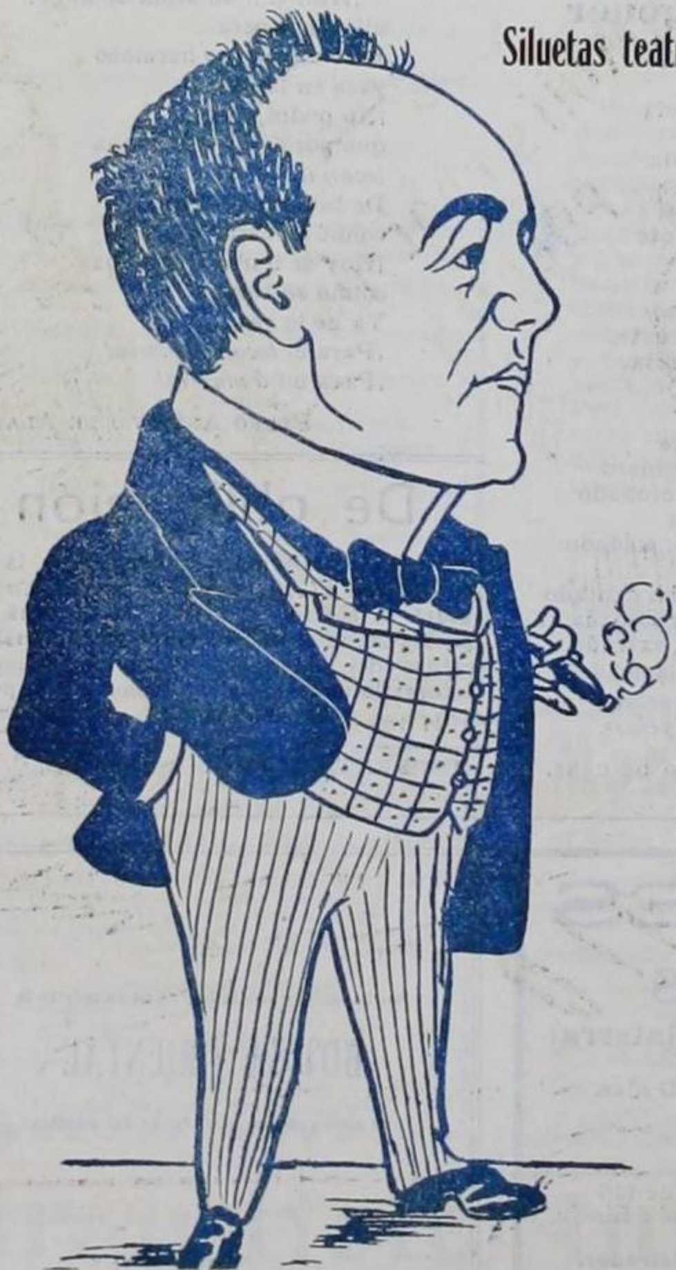
Francisco Puiggener Primer Baritono