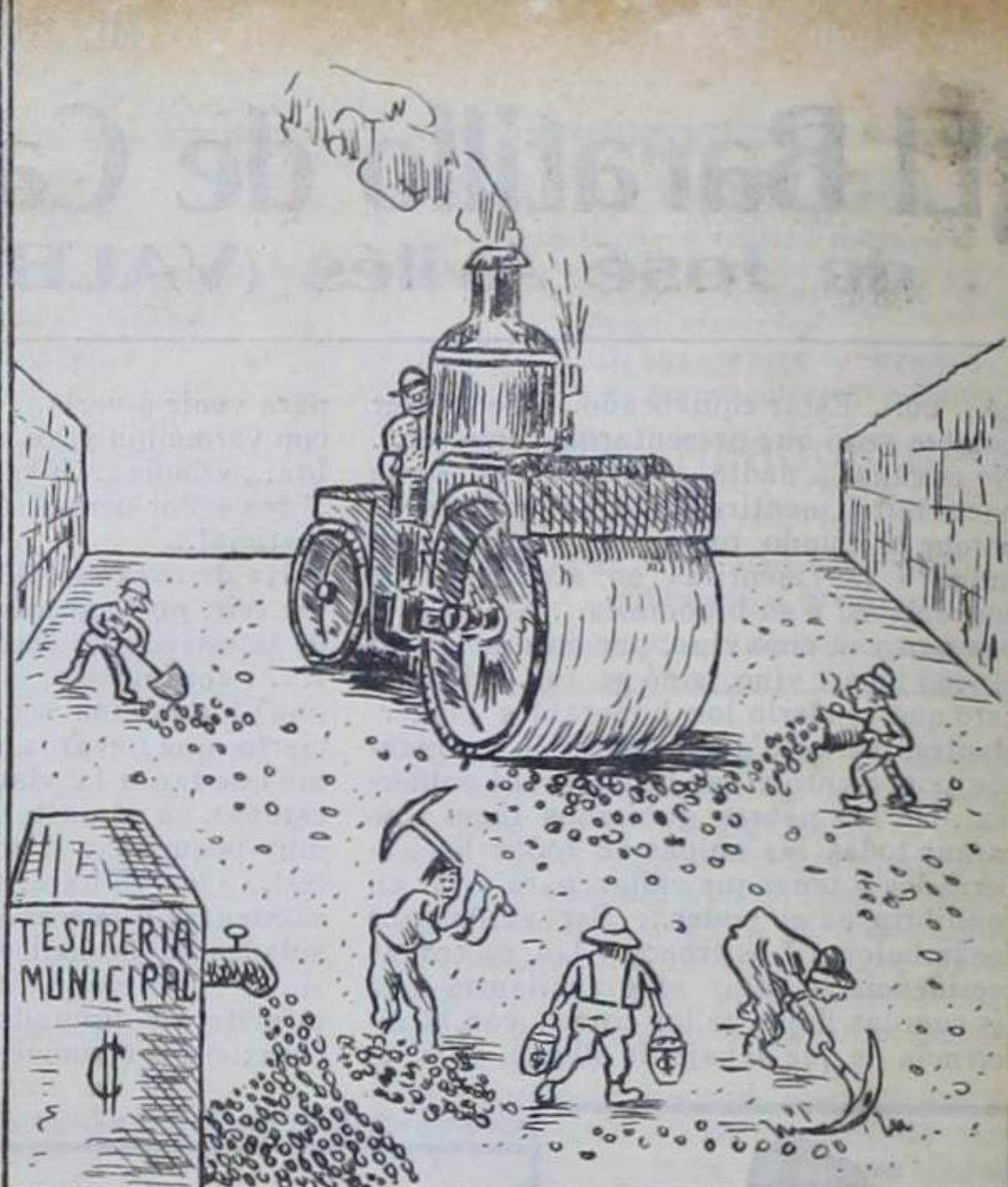
LOS GRANDES INVENTOS.—Nuevo sistema de asfaltar calles, patentado por la Municipalidad de San José.

NOTA.—Este prodigio del ingenio humano, está en exhibición frente a la casa presidencial, donde su inventor recibe todos los días, de 12 a 5 p. m., las felicitaciones del público.