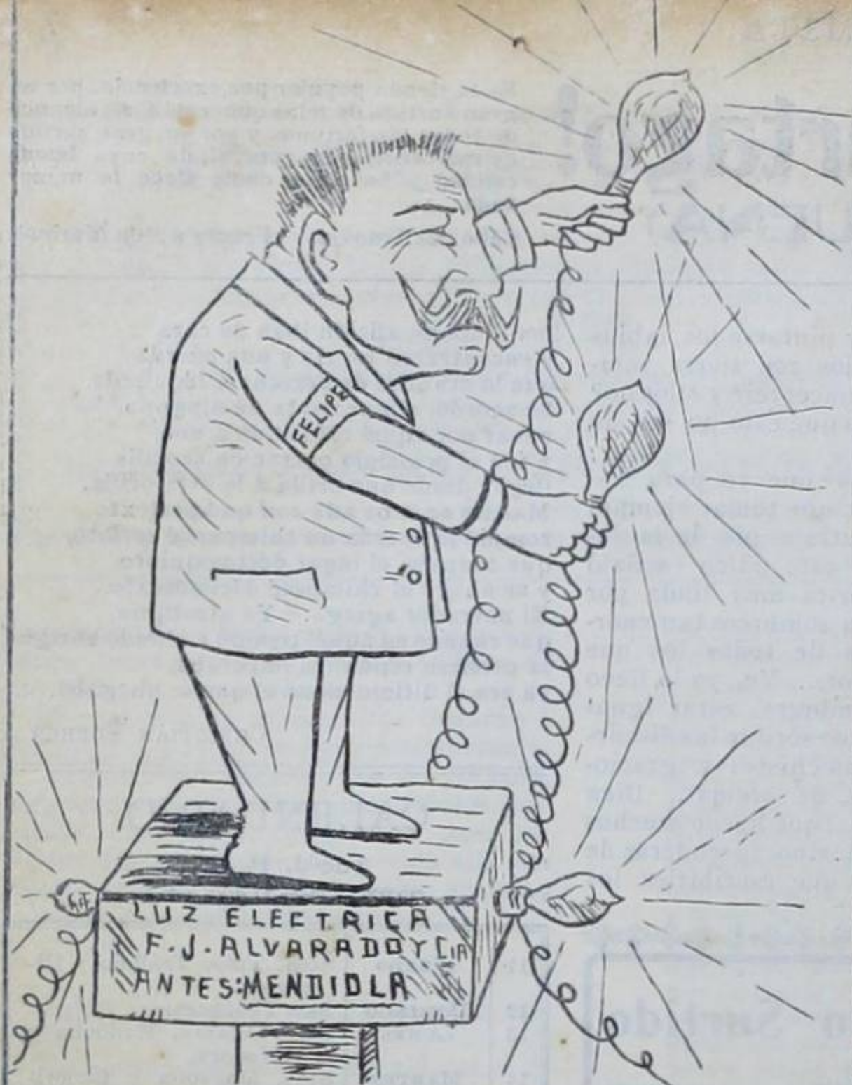
El hombre que ha hecho más luz en las actuales dificultades económicas.