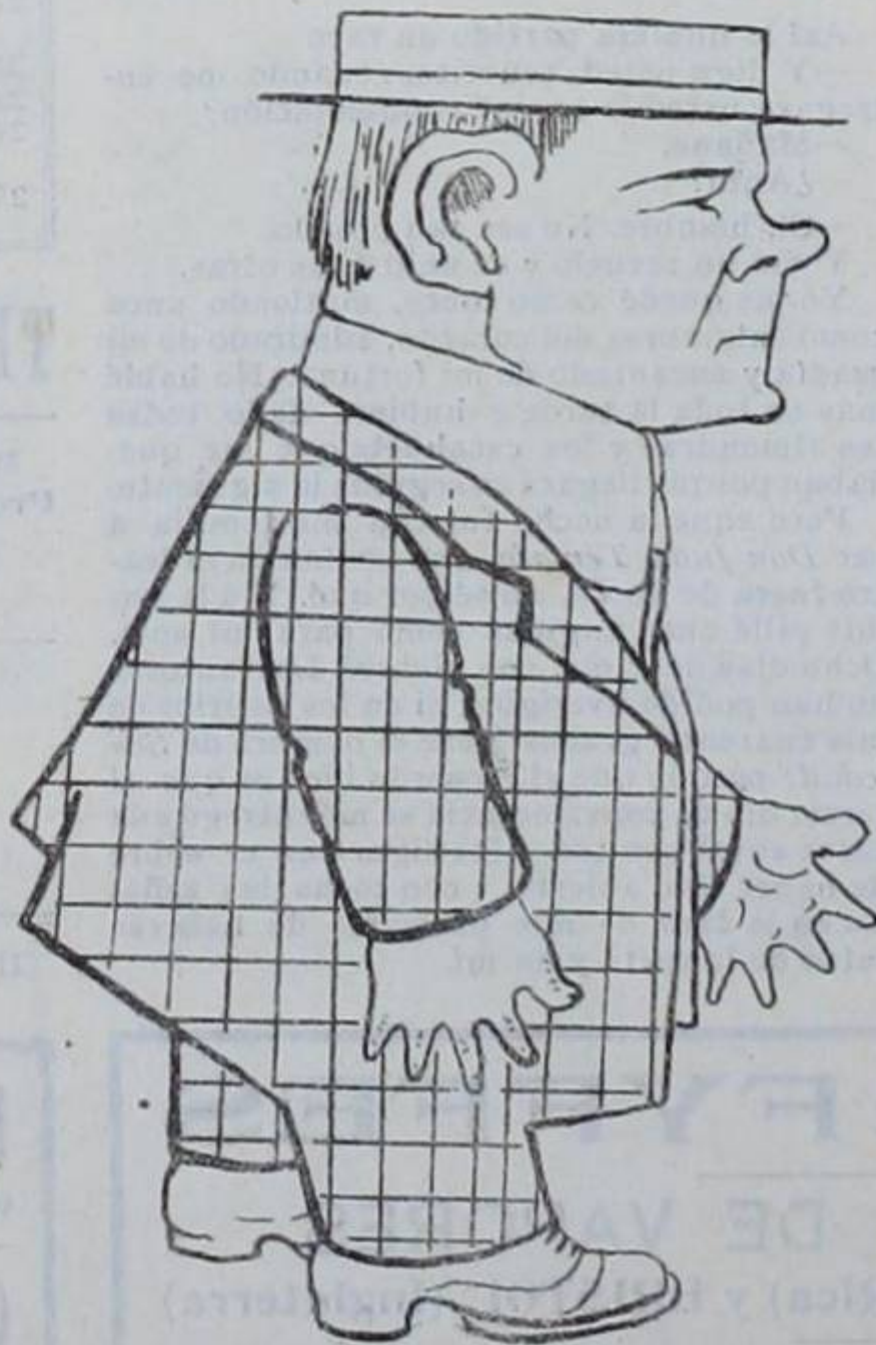
EL SECRETARIO DEL BIG MAN.... AGER.

Un joven muy entendido en ferrocarrilería, que en una gran Compañía muchos años ha servido: estaba recién nacido