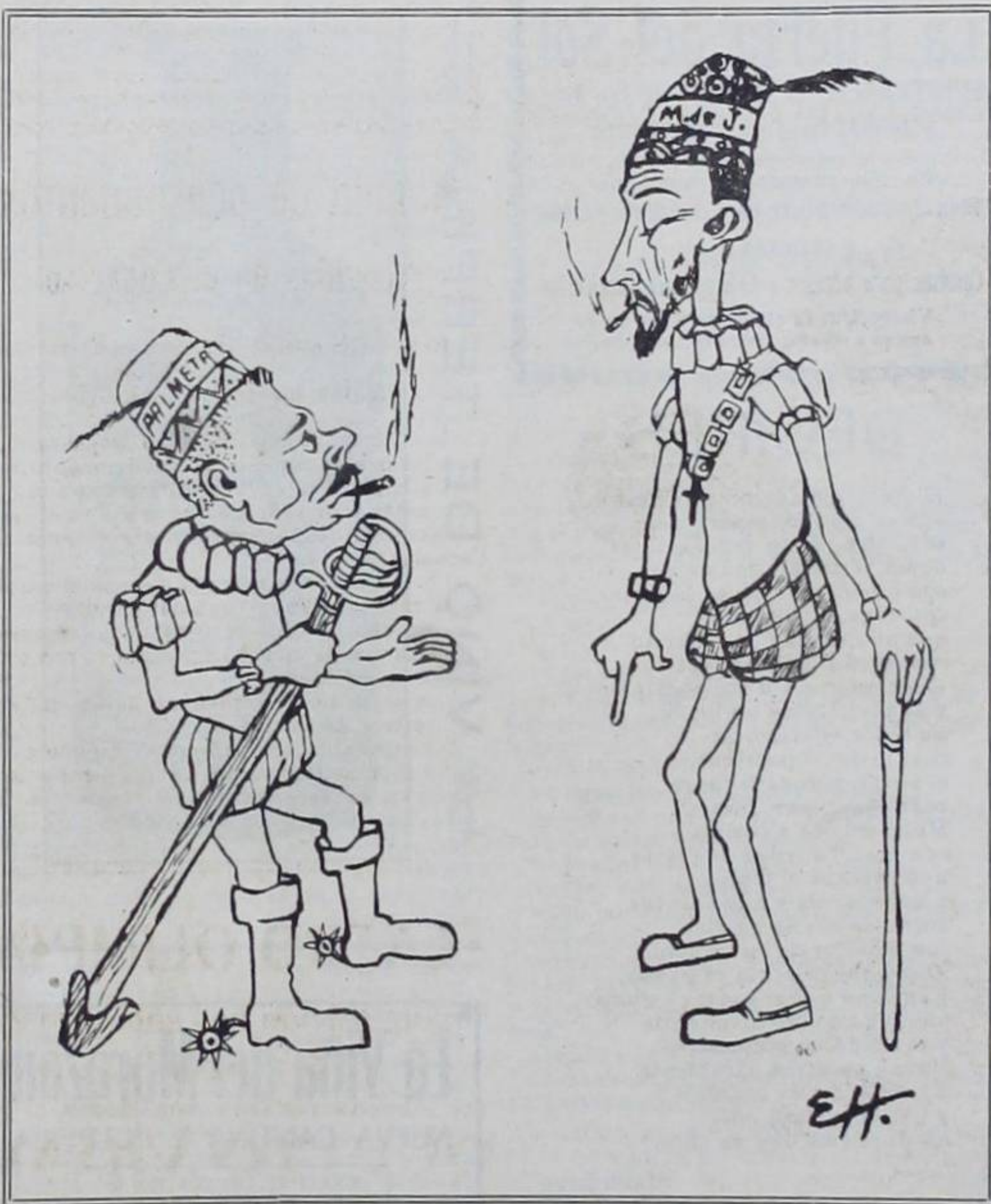
Don Felipe Segundo y el Ministro de la Guerra..... á la Instrucción Pública, se ponen de acuerdo

Don Felipe. —Bravo, amigo mío. Dios tarda pero no olvida: llegó el momento de poner en práctica nuestro plan. □