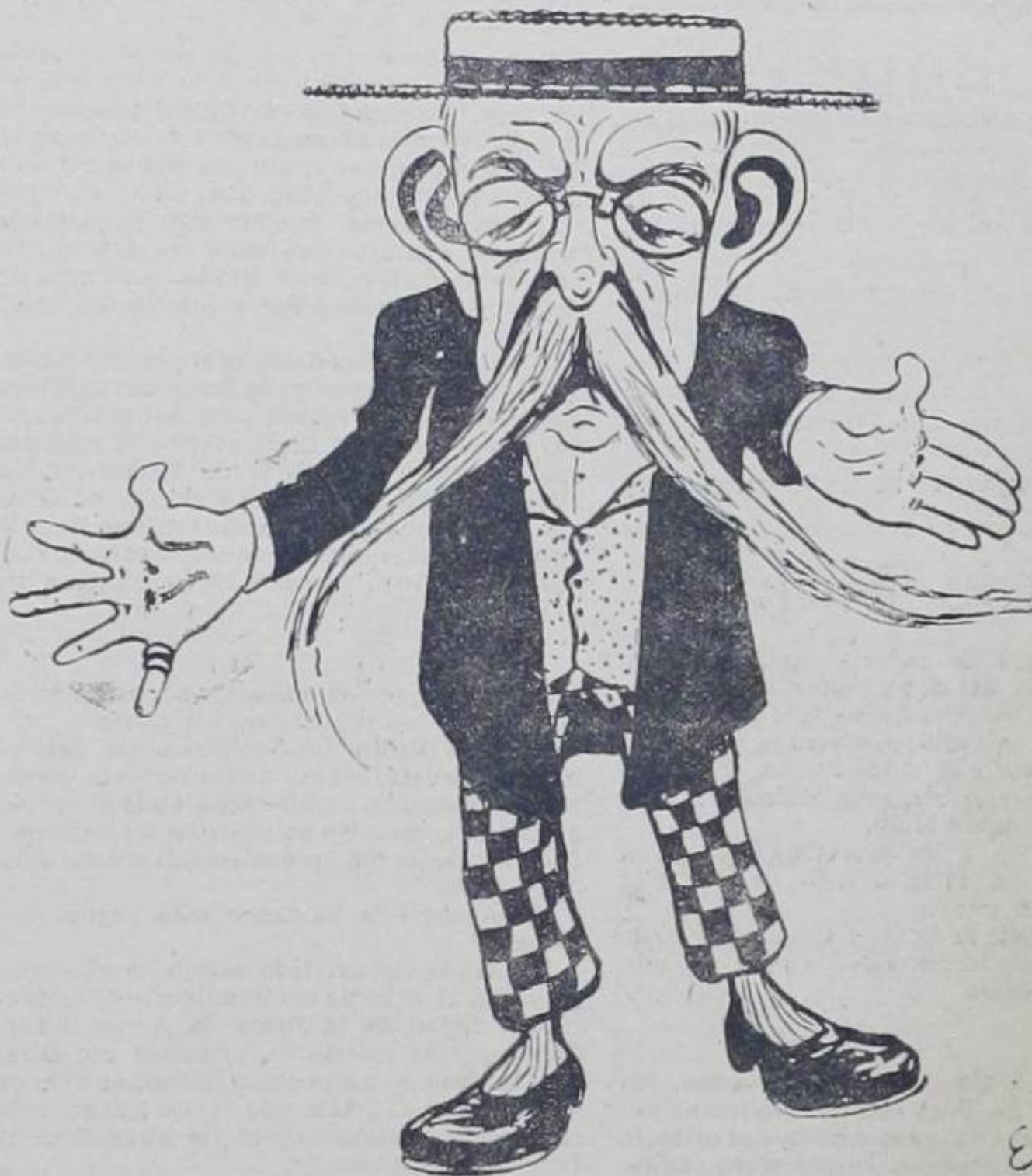
SR. FRANCISCO PORTO Y CASTILLO Encargado de Negocios de Cuba

Un respetable señor de muy sano y buen humor hombre agradable y simpático que hace, en verdad, gran honor á su puesto diplomático.