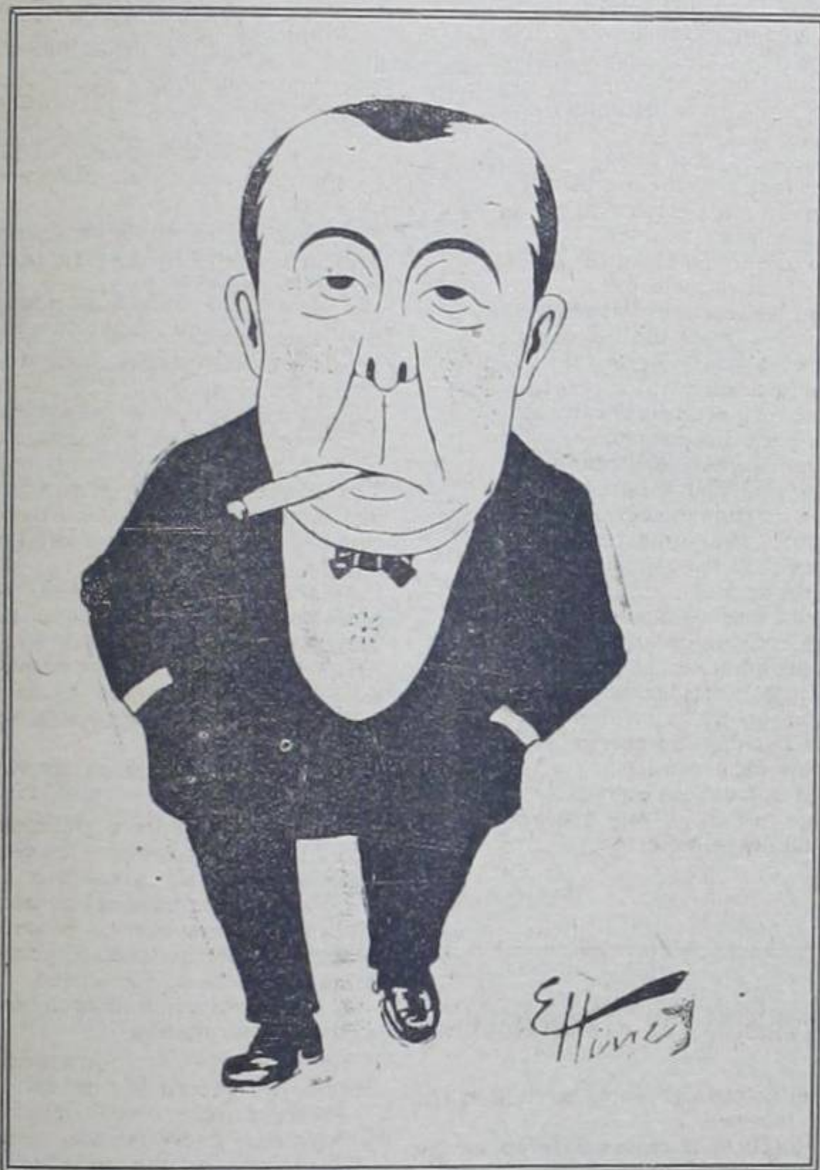
SR. MIGUEL MUÑOZ

Primer actor de la Compañía que lleva su nombre y que actúa en el Teatro Nacional