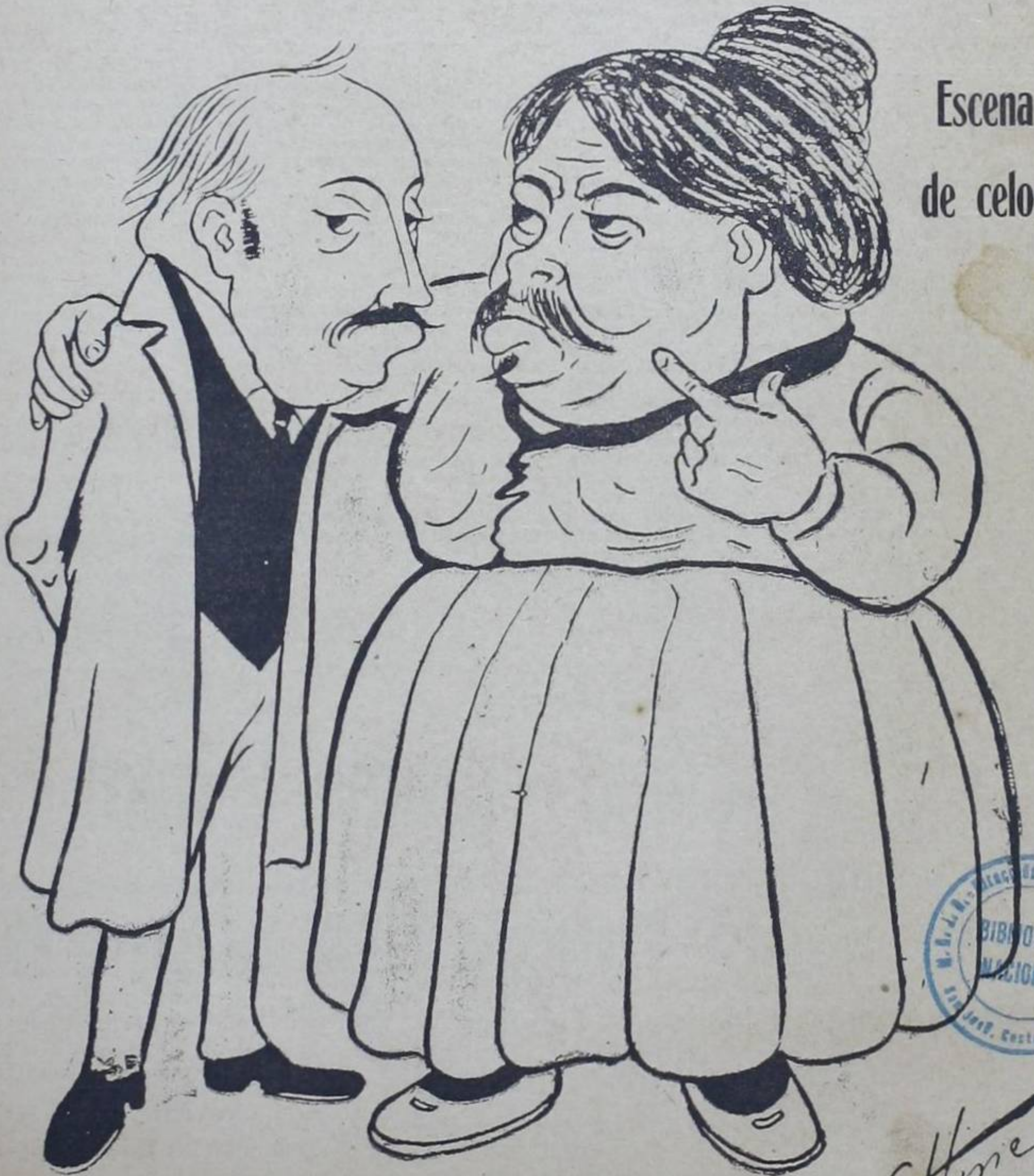
DOÑA MAXIMA (celosa). ¡Tú me estás engañando, Ricardito.....!