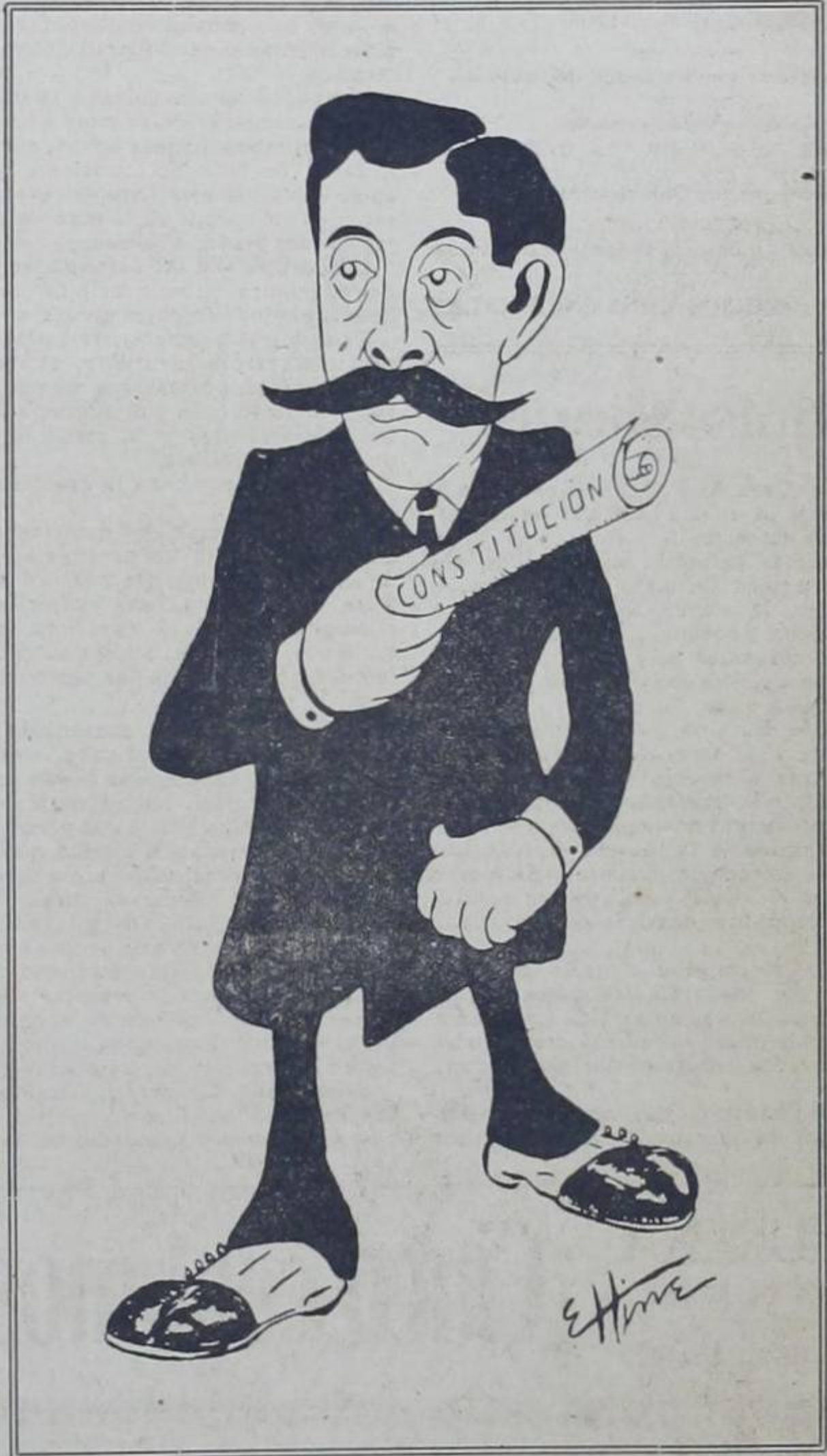
Dr. don Manuel E. Araujo, Presidente Constitucional de la República de El Salvador.

Conocida es la figura de este ilustre ciudadano que, con la ley en la mano, de su patria el bien procura. En esta caricatura