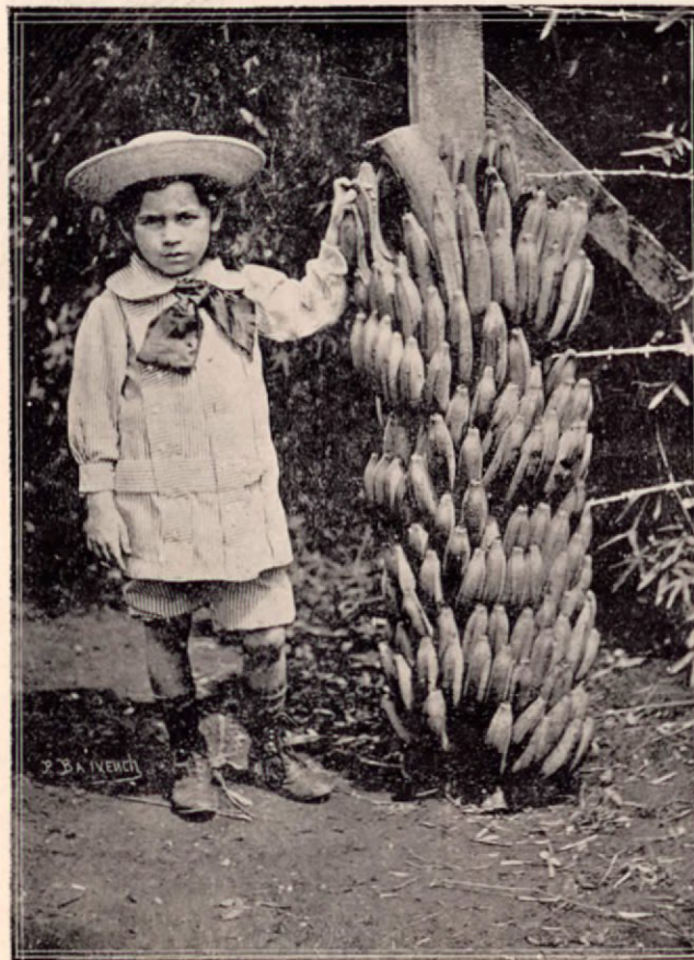
Racimo de banano, cortado en una de las fincas de la United Fruit Co.