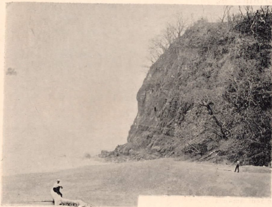
Vista del cerro Carballo

Ramal en construcción entre Santo Domingo de San Mateo y Puntarenas