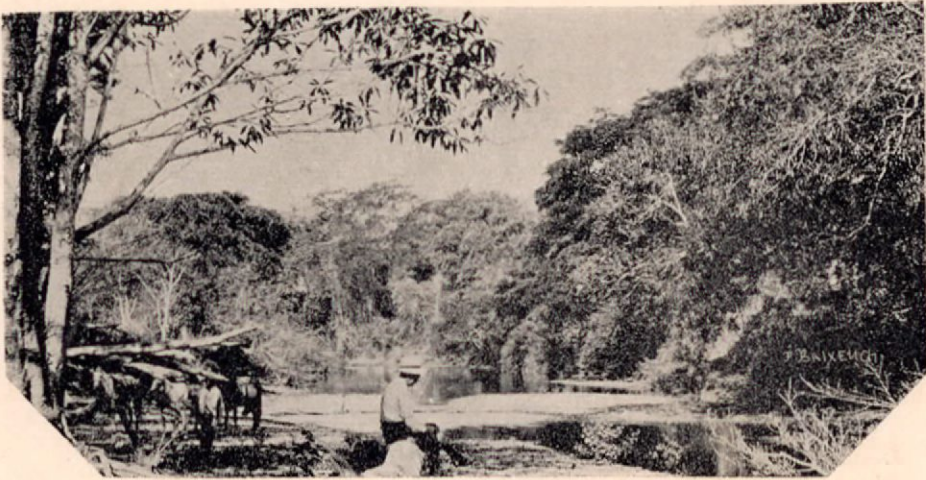
Cruce de la línea sobre el río Jesús María

Ramal en construcción entre Santo Domingo de San Mateo y Puntarenas