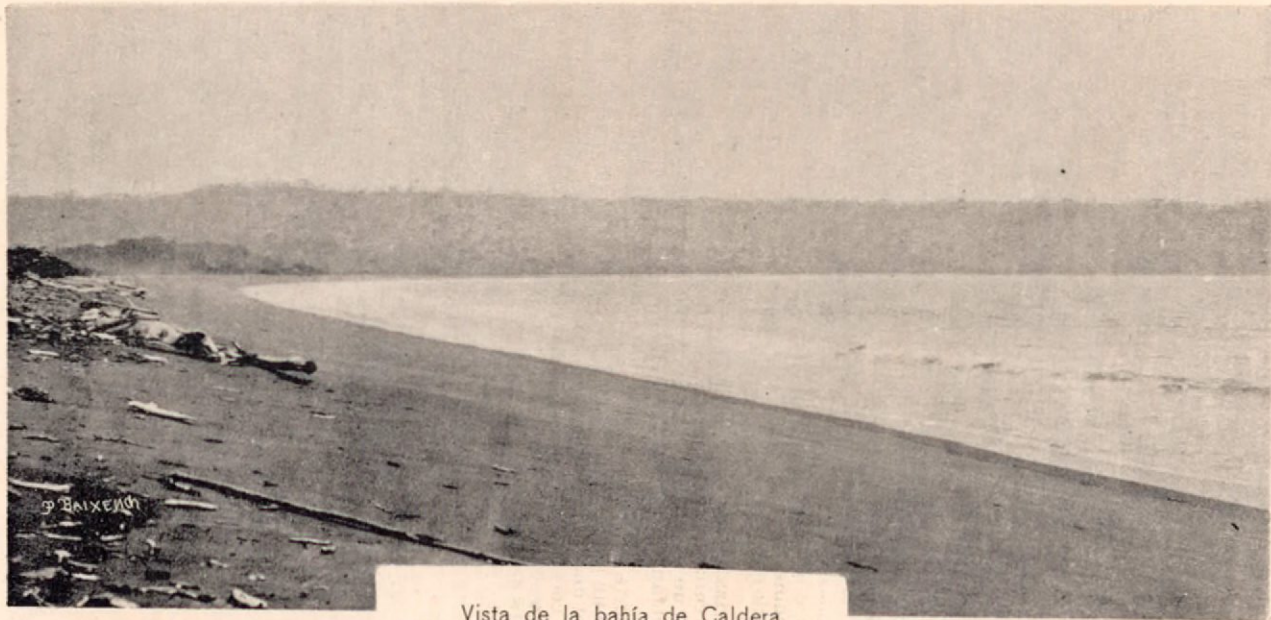
Vista de la bahía de Caldera

Ramal en construcción entre Santo Domingo de San Mateo y Puntarenas