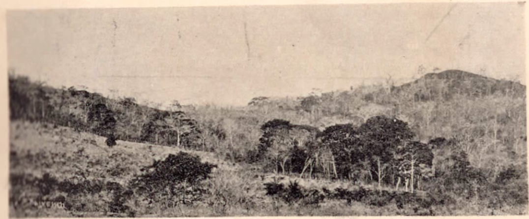
Vista al Este del monte Cambalache

Ramal en construcción entre Santo Domingo de San Mateo y Puntarenas