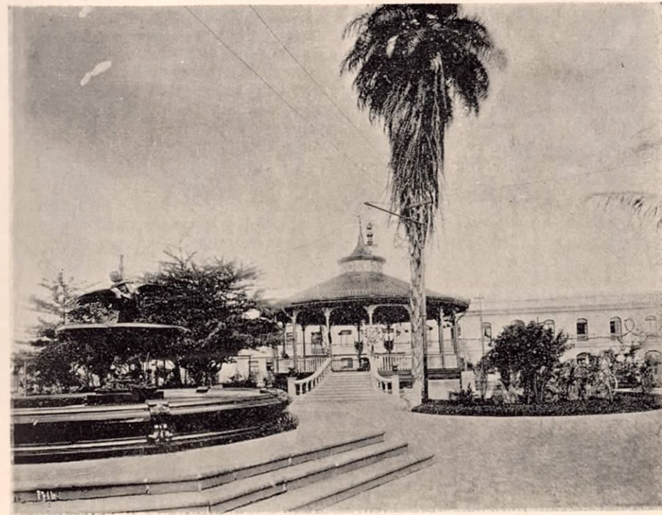
Una vista en el Parque Central de San José