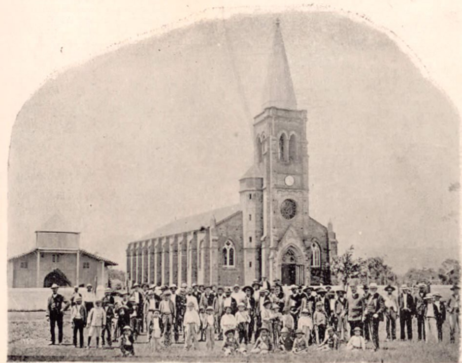
Vista de la iglesia de Paraiso y grupo de paisanos y empleados públicos

Nosotros repetiremos lo mismo, porque á la verdad, Heras nos impresionó y nos dió una muestra de su talento y de la esquisitez de su alma de artista.