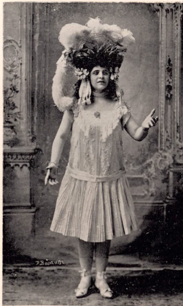
Esperanza Iris en "La Muñeca"

El recinto augusto tiene impregnada una alma especial, sin duda de la familia de las almas de cántaro.