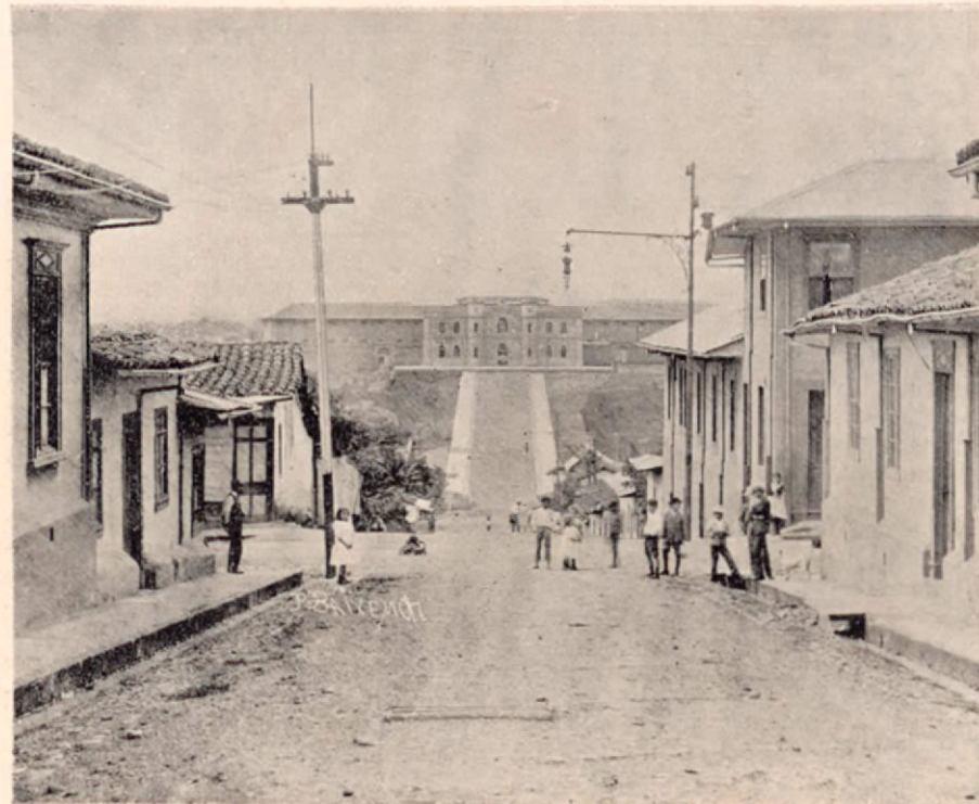
Vista de la Cárcel nueva