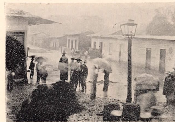
Calle á cien varas al Norte de la plaza