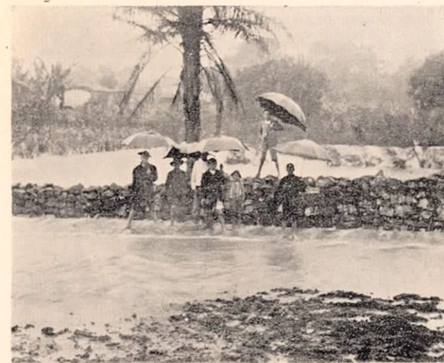
Calle y solar situados 100 varas al Norte del Mercado