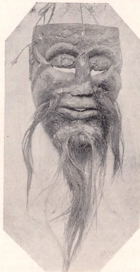
Máscara indígena traída de Térraba por el doctor Fernández La usan los indios en sus bailes y se cree que tiene siglos de edad

Ya iban á absolverle en la deliberación subsiguiente, cuando uno de los escribas que era á la vez concesionario de las pesquerías en el lago de Genezaret, donde Jesús multipli-