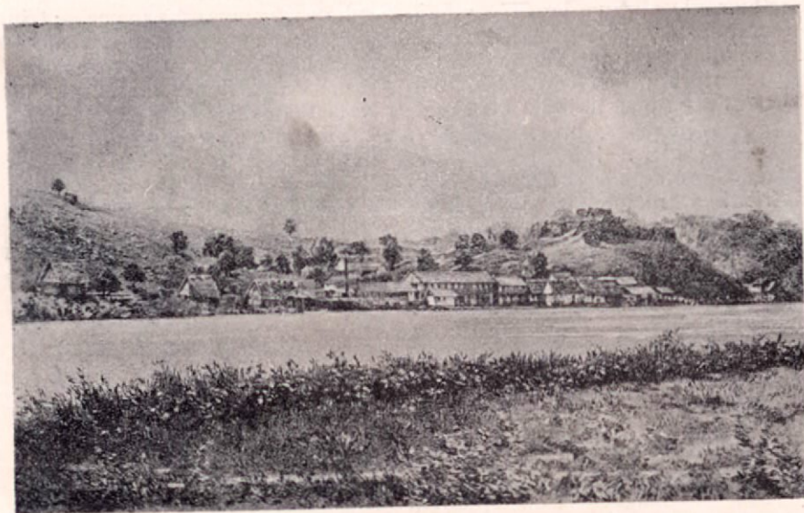
El Castillo Viejo sobre el río San Juan de Nicaragua

Anselmo y Susana se comprendían, se adivinaban, se presentían se amaban.