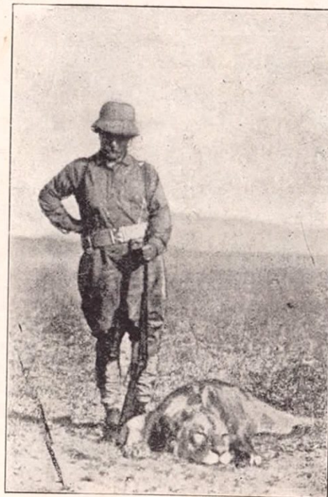
Theodoro Roosevelt en su traje de cacería en Africa.

Se dijo en Estados Unidos que había muerto devorado por un león en las selvas de Uganda, pero resultó falso el rumor.