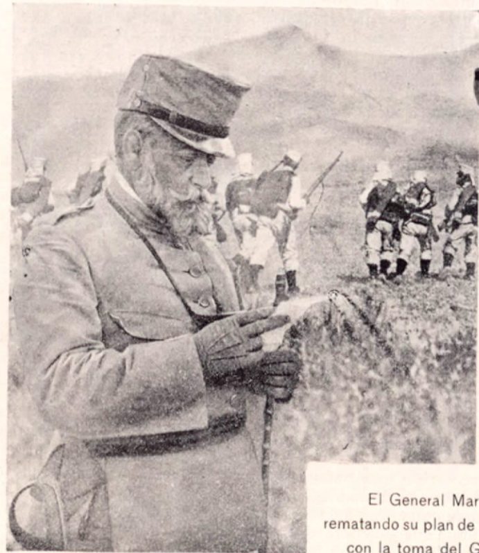
El General Marina rematando su plan de campaña con la toma del Gurugú

Prévost me enseña toda la casa; luego salimos al jardín; es un precioso rinconcito verde, desde donde