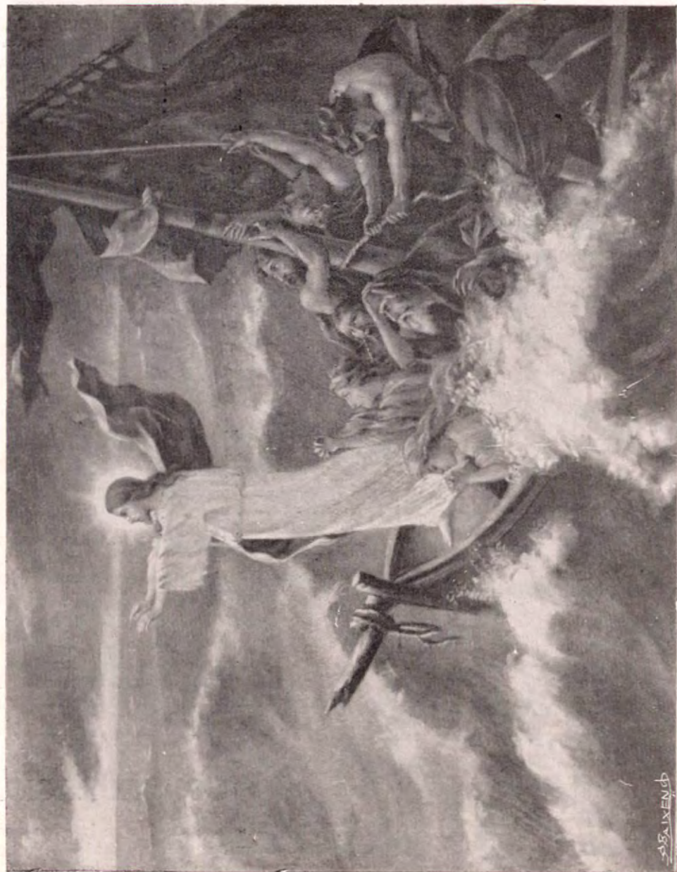
JESUS APLACA LA FURIA DE LOS MARES