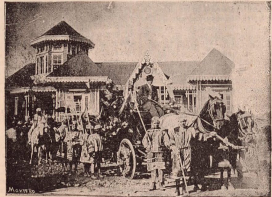
CARROZA EN LA QUE IBAN LOS REYES MAGOS