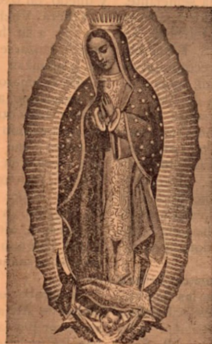
NUESTRA SRA. DE GUADALUPE

Publicada por los PP. Capuchinos de Centro América