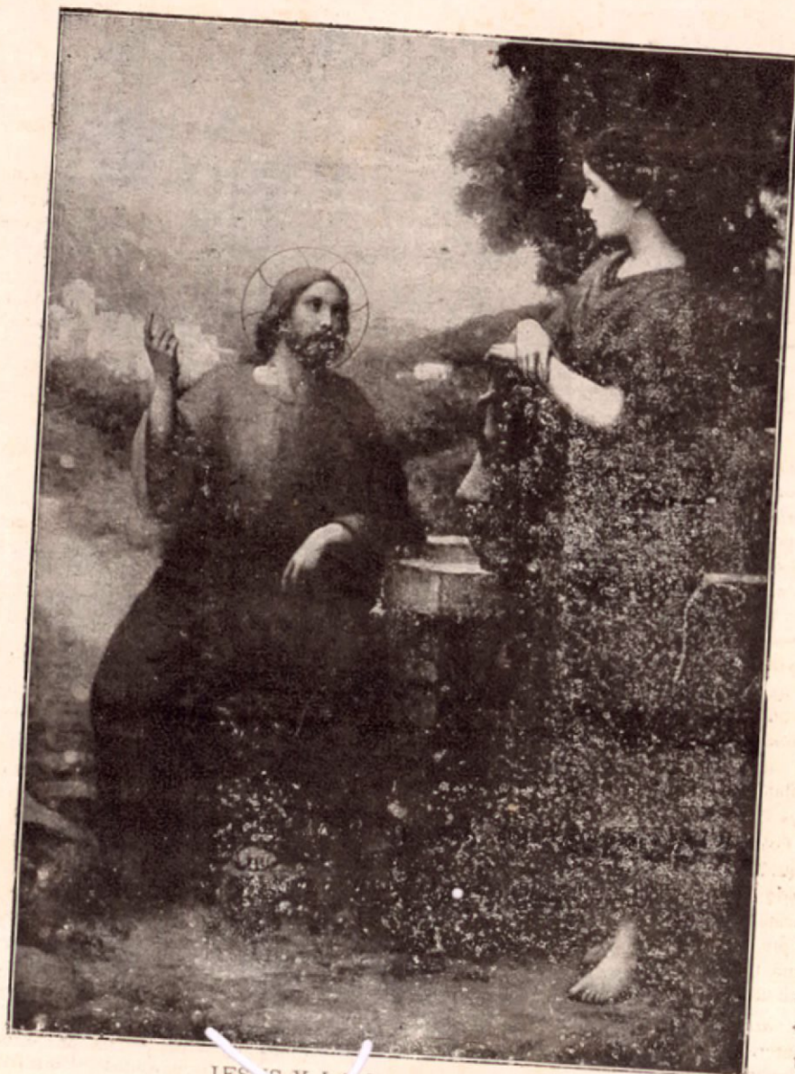
JESUS Y LA SAMARITANA

Publicada por los PP. Capuchinos de Centro América