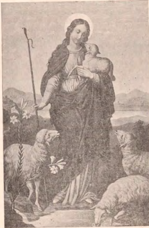
Nuestra amable Patrona

Ruégase muy encarecidamente que procuren aprovecharse del grandioso tesoro de Indulgencias Plenarias que tan generosamente les concede la Iglesia para que se animen a portarse como verdaderos Hijos del Seráfico Padre San Francisco. No olviden nunca y aprovechen también con la mayor frecuencia que les sea posible la gracia especialísima llamada: Indulgencia de la Estación, por la que: Los Terciarios de San Francisco en cualquier tiempo y lugar, que rezaren seis padrenue-