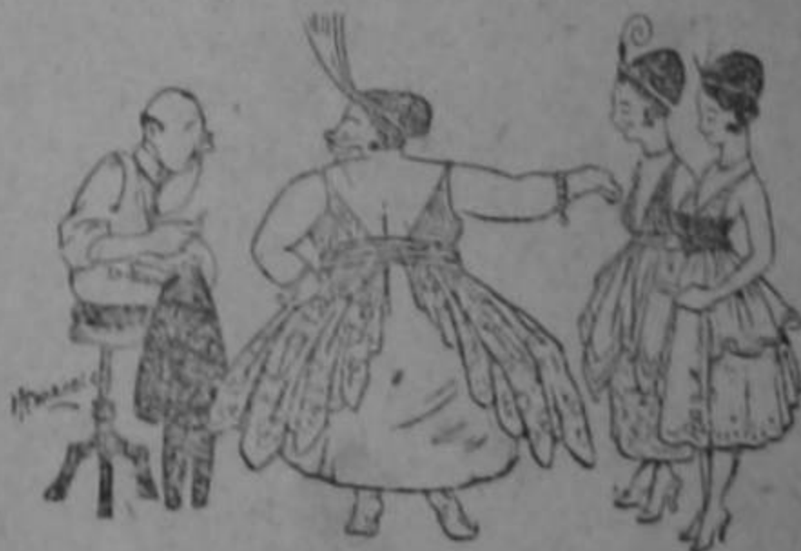
Remendando los calzones.