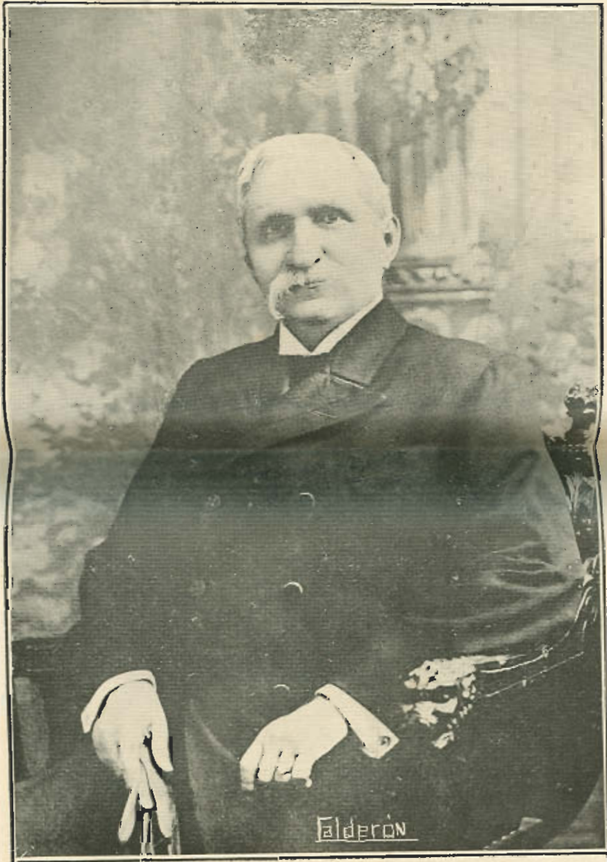
José Domingo de Obaldía

Electo Presidente de la República de Panamá, quien tomará posesión de su alto cargo en el mes de octubre próximo