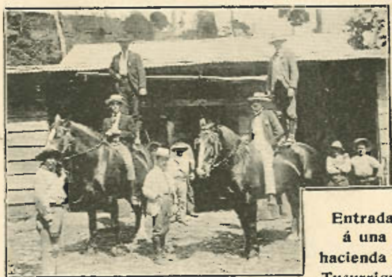
Entrada á una hacienda de Tucurrique