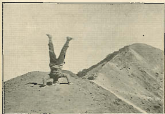
En el Irazú.—Excentricidad yanqui