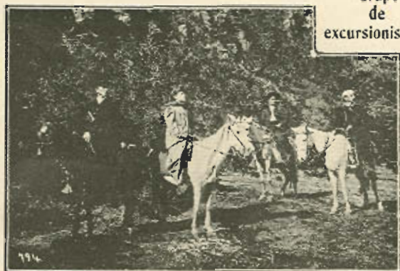
Grupo de excursionistas