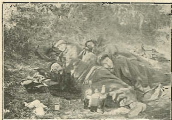
Durmiendo al pié del volcán