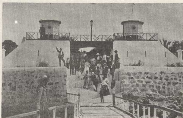
Puntarenas, Costa Rica.—Presidio de San Lucas

Artº 5º.—El servicio antropométrico estará á cargo de un Jefe de gabinete, quien tendrá como obligación: a] Dirigir y vigilar todos los trabajos que sea preciso ejecutar; b] Comunicar á la autoridad respectiva el resultado de sus observa-