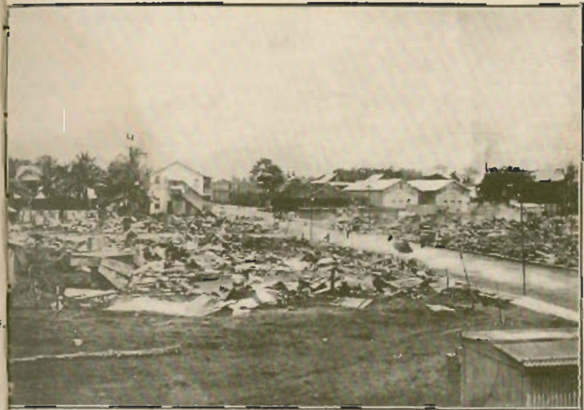
Fotografía tomada de Sur á Norte, Calle 5ª