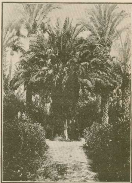
Elche (Alicante). La Palmera del Cura, visitada por Mr. Flammarión el 28 de marzo de 1900

«Los 79 segundos de la totalidad han pasado. Un resplandor deslumbrante brota del sol haciendo ver que la Luna, siguiendo su cur-