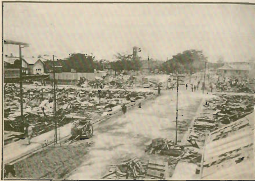
Fotografía tomada de Oeste á Este, Avenida B.