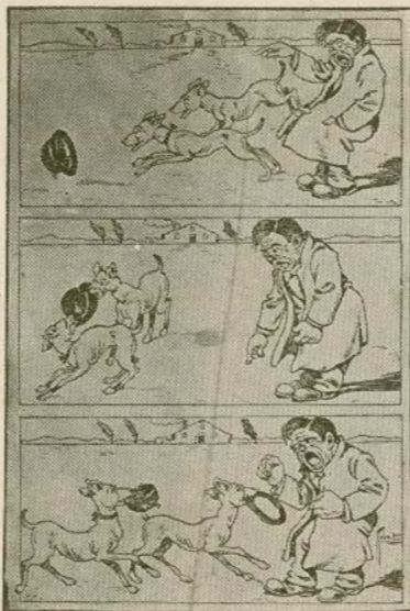
Los perros serviciales