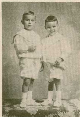
Niños Guier (Cartago)