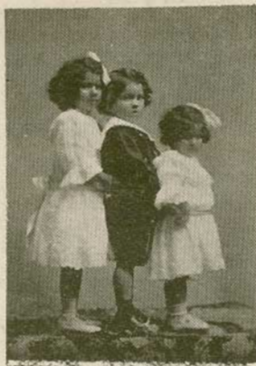
Niños Obregón Loría