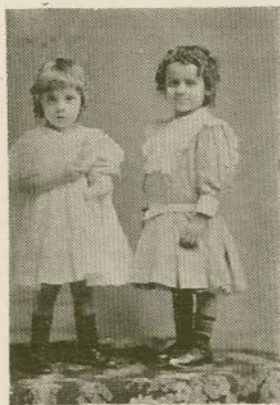
Niños Mezerville Quiros