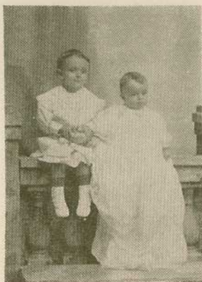
Niños Pinto Echeverría