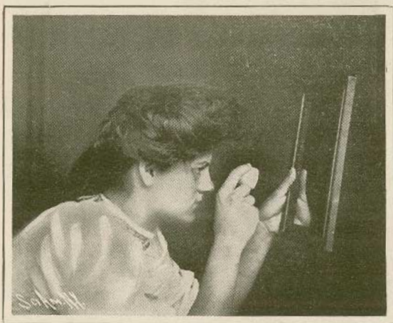
Una ilusión de óptica

tal modo que quede reducida á un solo hemisferio. En la concavidad de éste se dibuja, con un lápiz, una cruz cuyos brazos terminen en punta y en el centro de la cruz se hace un agujero del diámetro de un lápiz, poco más ó menos. El experimentador se coloca frente á una ventana, de tal modo que la luz caiga sobre la cara y no sobre el espejo que él tiene en la mano. El cierra un ojo y coloca la cáscara entre el ojo