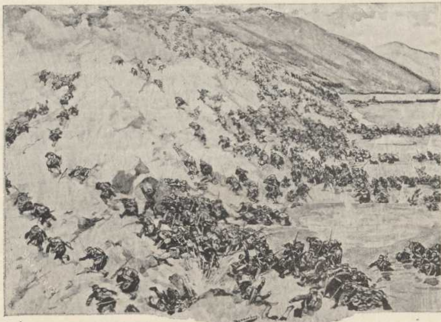
EN EL YALÚ.—ASALTO DE LAS POSICIONES RUSAS

menhires de granito, llevando cada una el nombre del samurai que debajo reposa y todas marcadas con el signo especial: Harakiri , el cual quiere decir que esos hombres han muerto de la manera terrible, propia de las gentes de honor: abriéndose el vientre con su propio puñal.