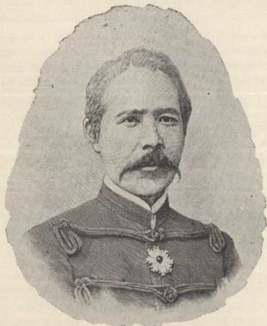
EL GENERAL KUROKI

Paz de Bobón Infanta de España Princesa Luis de Baviera