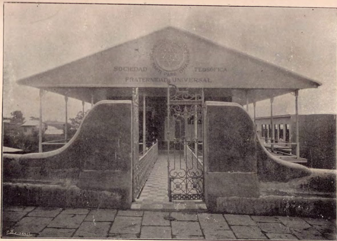
Fachada del CENTRO TEOSÓFICO, en San José de Costa Rica (Lado Norte)