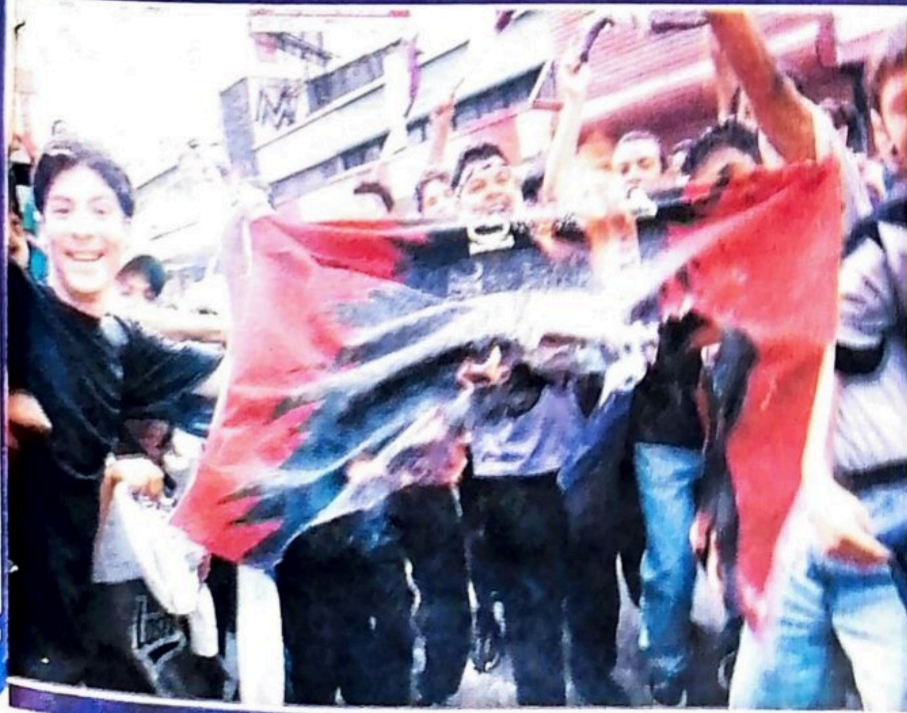
TROFEO DE QUERRA. Un grupo de aficionados morados "capturaron" la bandera de un liguleta que pasó por donde estaban y le prendieron fuego al distintivo manudo.