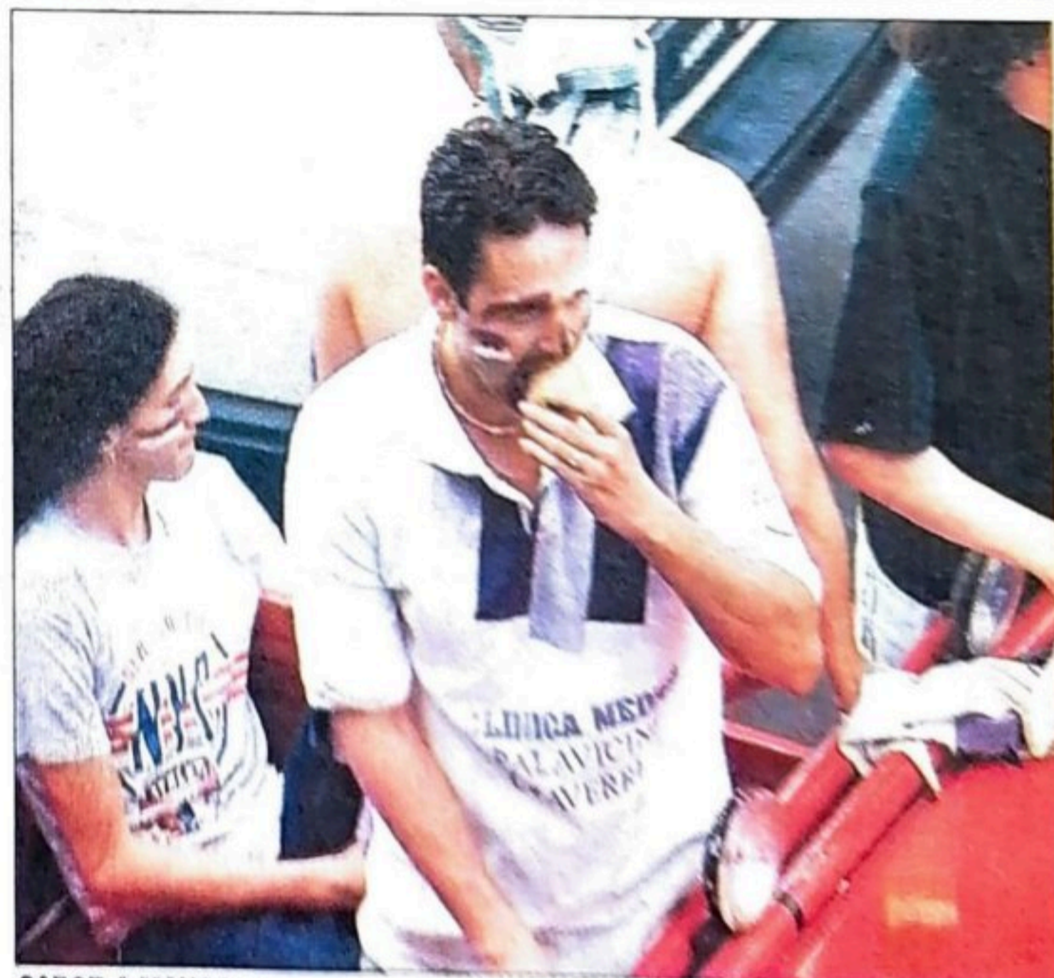
SABOR A MANGO. Este saprissista se vengó a su manera de los liguistas: pasó comiendo mangos durante buen tramo del desfile.