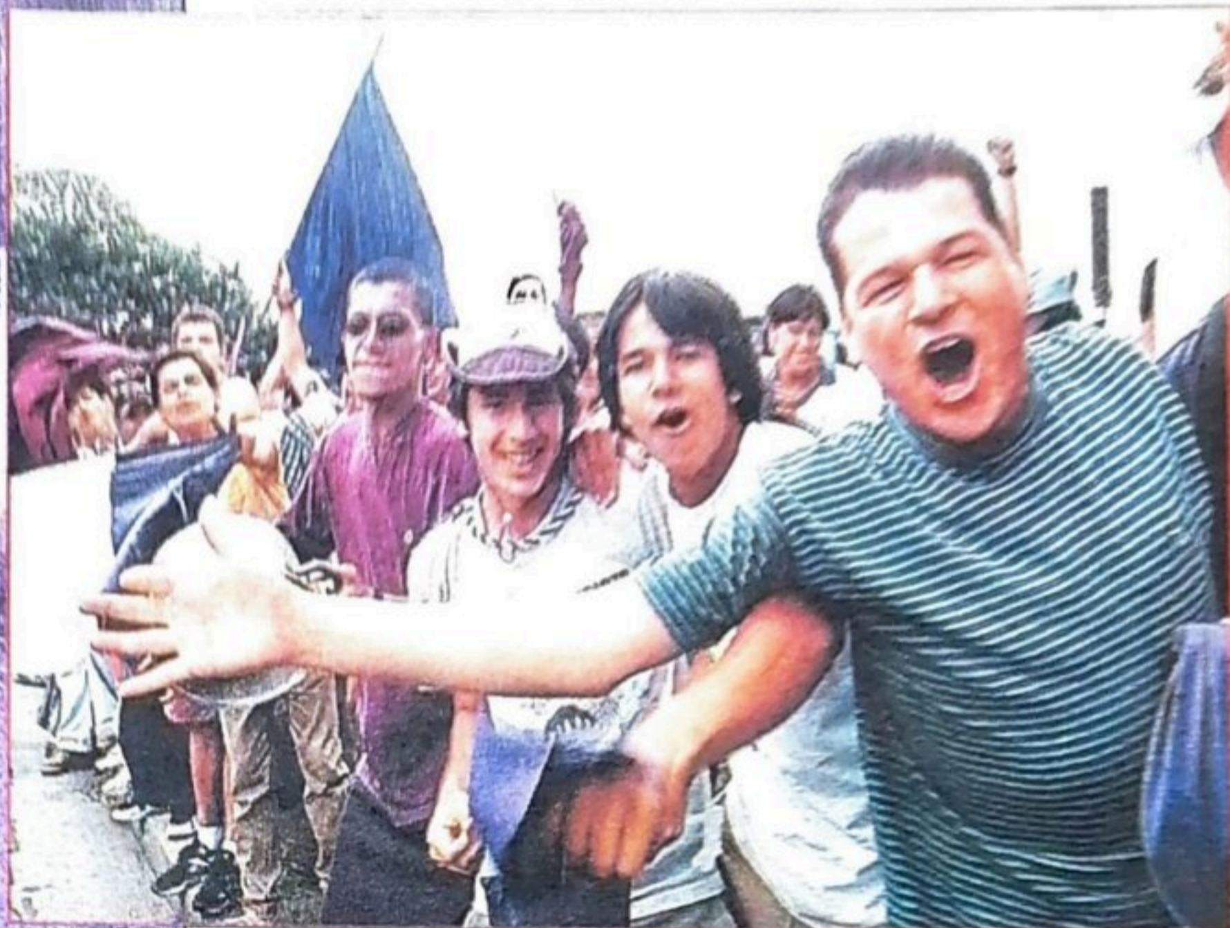
RIO TRADICIONAL. Los Yoses, específicamente frente al bar Río, fue escenario de las primeras celebraciones. Esta vez hubo mucha vigilancia policial para evitar problemas.