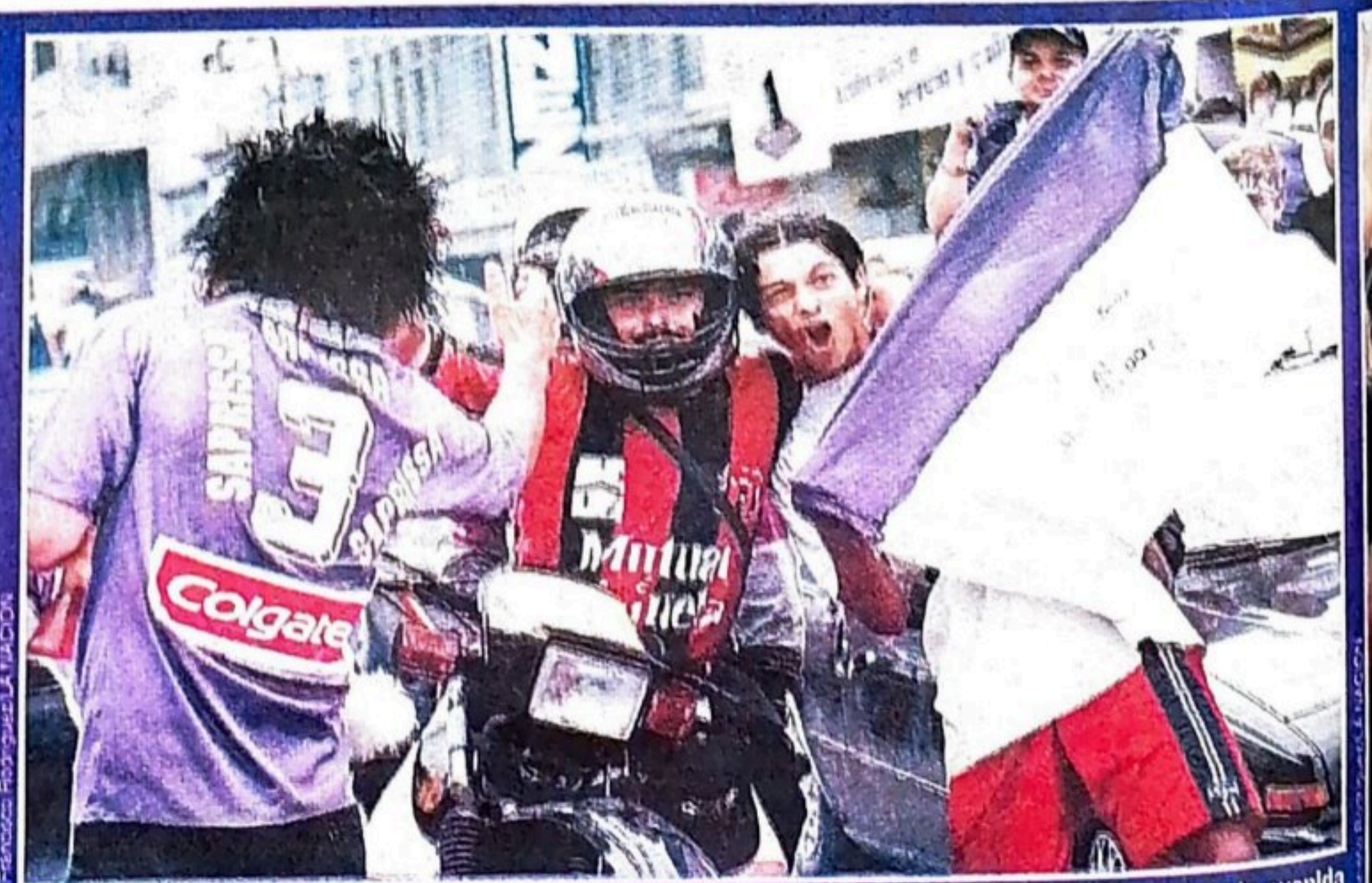
ATREVIDO. Este aficionado manudo no se amodrentó con la nube morada que cubría por completo la avenida segunda. Su gesto fue bien recibido por los saprissistas, muchos hasta lo saludaron.