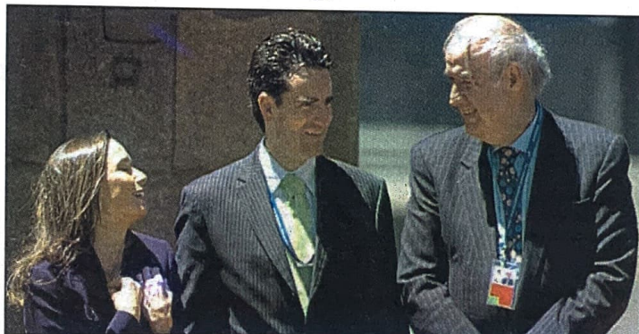
En Chile, el Canciller Bruno Stagno fortaleció la cooperación internacional de tipo académico.

Con el acuerdo, las dos instituciones man-