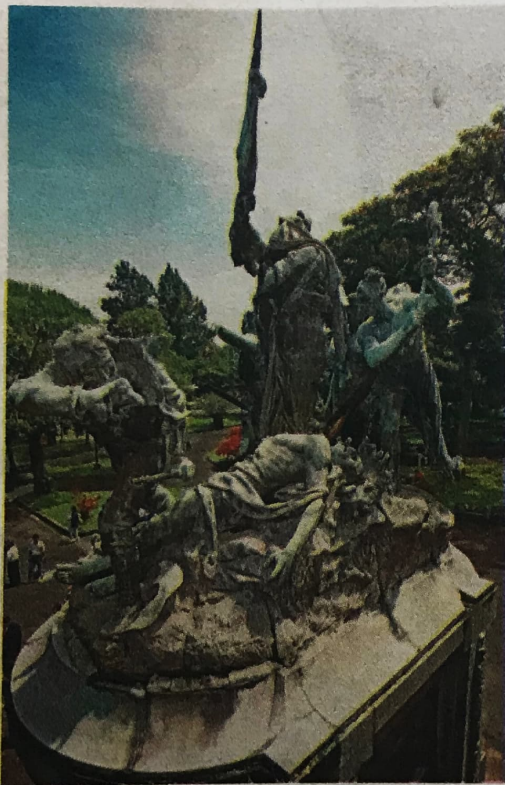
Ya que este año el Monumento Nacional no podrá ser visto, la Compañía Nacional de Danza lo recreará en movimiento.

Y diferente será, también, la música de esta celebración, porque además