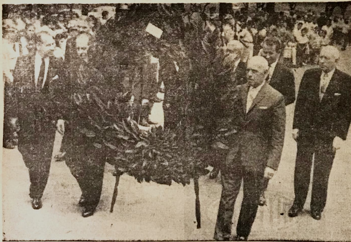
CUERPO CONSULAR RINDIO HOMENAJE EN EL MONUMENTO NACIONAL. — En horas de la mañana de ayer, más de cuarenta miembros del Cuerpo Consular acreditado en esta capital, participaron en la ceremonia de colocar una ofrenda floral en el Monumento Nacional, con motivo del 140º aniversario de nuestra independencia. La ceremonia fue sencilla, pero no por ello menos significativa.