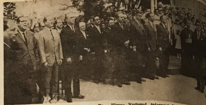
EN EL PARQUE. Miembros de los Supremos Poderes, Cuerpo Diplomático, invitados especiales y considerable cantidad de público escucha el Himno Nacional, interpretado por el coro y la banda del Conservatorio Castella.

Todos queremos que nuestro país sea mejor: anhelamos que cada costarricense reciba educación que lo prepare para su desarrollo personal, para su vida intelectual, de independencia económica, afectiva y para su vida de hogar; que se prepare para interesarse por el provecho de sus conterráneos, para saber respetar las instituciones, para ejercitar juicio-samente sus derechos, para ser tolerante, para usar maneras razonables de pensar y de actuar. Y deseamos que todos estos objetivos se encarnen en lo íntimo de los costarricenses que hoy se forman, a fin de