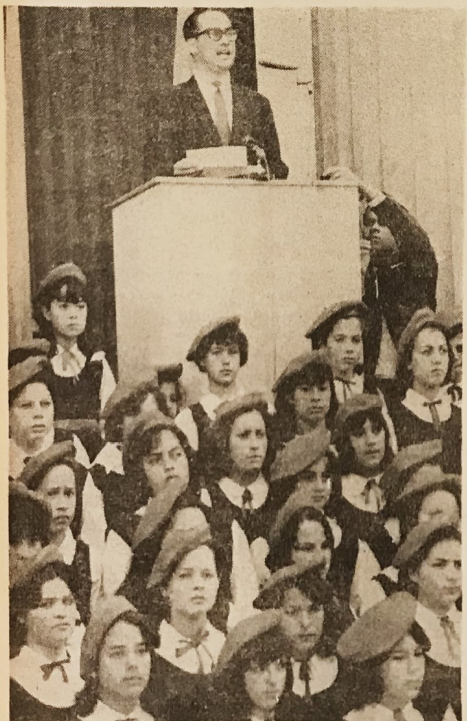
DISCURSO. Antes de tomar el juramento a la Bandera el Ministro de Educación pronunció un discurso, dijo que la Patria no es sólo para hablar de ella un día, que en ella debemos pensar siempre.

que no caigan ni en la indiferencia que nada quiere y por nada se interesa ni en la violenta rebeldía que destruye nuestro tradicional estilo en la vida de relación ni en la sola búsqueda de la egoísta satisfacción personal. Para alcanzar lo que consideramos mejor, pongamos decididamente nuestro esfuerzo y nuestras más caras esperanzas en ennoblecere nuestra educación; comprometámonos de modo formal a observar la Constitución y las leyes, a servir a la Patria, a defenderla y a contribuir a los gastos públicos —como lo establece nuestra Carta Fundamental; comprometámonos a mantener incólumes los aspectos esenciales de nuestra nacionalidad; y plasemos este compromiso en el juramento a la