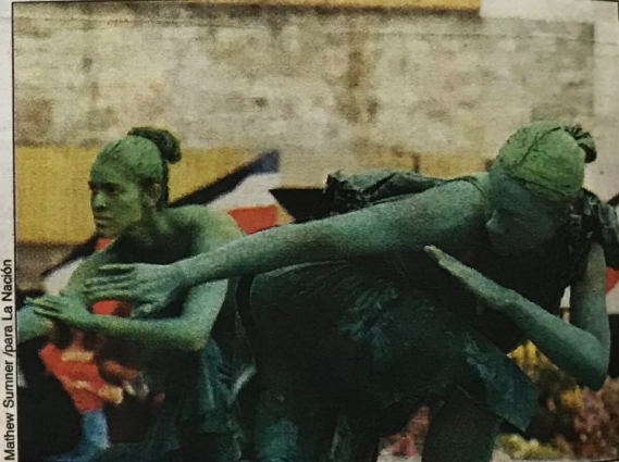
DE CARNE Y HUESO. Si no está, lo traemos. Los miembros de la Compañía Nacional de Danza representaron el Monumento Nacional en la plaza de la Justicia.