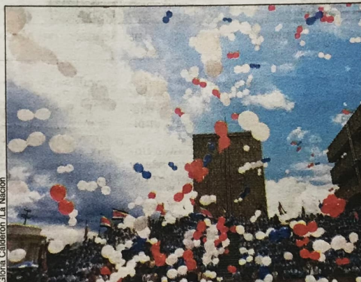
DE BLANCO, AZUL Y ROJO. Centenares de globos cubrieron el cielo al finalizar los actos oficiales en la plaza de la Justicia, en San José. Subieron a los acordes de la Patriótica Costarricense .