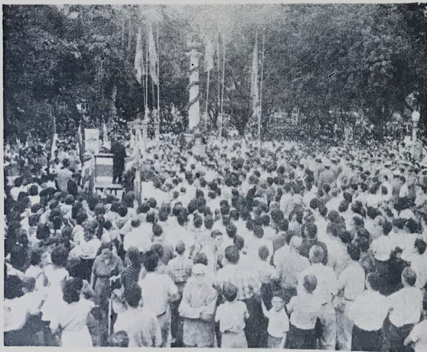
Enorme multitud congregada en el Parque Morazán escuchando los discursos que fueron pronunciados.