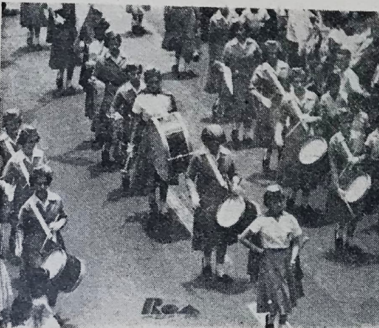
COLEGIO SAINT CLAIRE. — Este colegio femenino fue igualmente muy aplaudido, especialmente la banda que aquí presentamos, integrada por las alumnas.