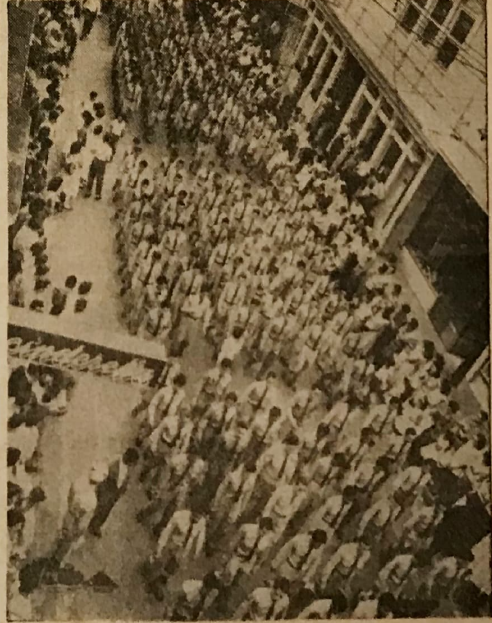
LICEO DE COSTA RICA.— Con su magnífica banda, trompetas y tambores, los liceístas fueron ovacionados en forma nutrida a su paso.

En las propias fuentes municipales se nos dijo que todo eso está en manos casi por entero de la Contraloría y la Asamblea.