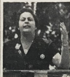
La Ministra de Educación Pública, Licda. Estela Quesada, en su alocución frente a las delegaciones de estudiantes al pie del Monumento del Soldado Desconocido, en el Parque Morazán.

"Señor Gobernador de la Provincia de San José, maestros, jóvenes estudiantes, señoras y señores: