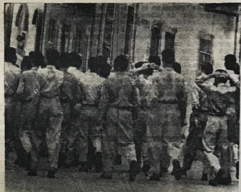
Alumnos del Liceo de Costa Rica, van por la Avenida Central con desgarro, las manos en el bolsillo, sosteniéndose la cabeza, viendo para todos lados, el uniforme sin planchar, peinándose y dándose bromas. La actitud de algunos de ellos fue muy acremente censurada por el público espectador.