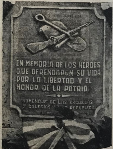
Placa en uno de los costados de la enhiesta columna erigida para perpetuar la memoria del Soldado Desconocido nacional.