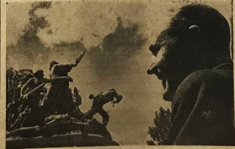
Bajo la esplendor del cielo de la patria se destacan las siluetas epónimas de las figuras que componen el grupo del Monumento Nacional y la fotografía, de perfil, del Primer Mandatario de la República, Lic. Mario Echandi Jiménez. Los escolares y colegiales desfilaron el 15 de setiembre delante de las bronces inmortales que se levantan sobre el pedestal de granito

Espontáneo comentario del señor Presidente de la República sobre las festividades patrias de la Independencia — Texto en la Pág. 15 —