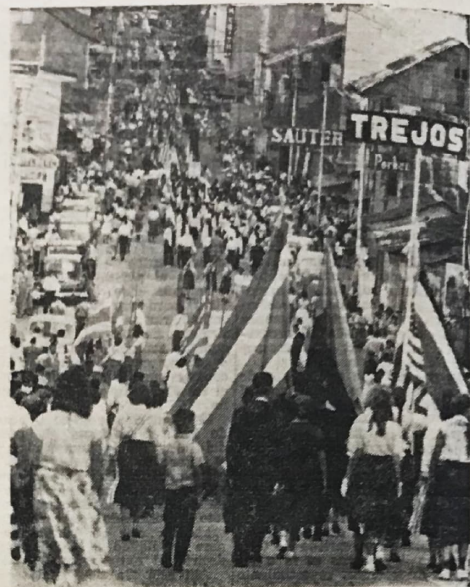
El desfile cuando baja la Cuesta de Mora.

Todavía se ataviaron artísticamente unas cuatro carrozas significativas de importantes actividades para la colectividad despuntando una que sobre seguridad era la representación de una esquina del corazón de la capital con su semáforo y dos otros vehículos en miniatura tripulados por niños de kindergarten u otros vestidos de guardias civiles.